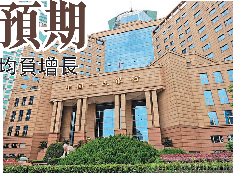
中國人民銀行公佈的數據顯示，8月末，中國廣義貨幣(M2)餘額151.10萬億元人民幣，同比增長11.4%，增速比上月末高1.2個百分點，比去年同期低1.9個百分點。

香港文匯報訊(記者 海巖 北京報道)中國央行14日發佈8月金融數據顯示，8月末廣義貨幣供應量(M2)同比增速回升至11.4%，增速比上月末高1.2個百分點，當月人民幣新增貸款9,487億元(人民幣，下同)，較7月幾乎翻倍，其中個人按揭貸款佔比過半，企業短期和中長期貸款卻雙雙負增長。市場人士分析，8月貨幣信貸均超預期，居民加槓桿仍是主因，企業融資仍存困難，企業去槓桿進行中，貨幣政策及流動性料繼續維穩。