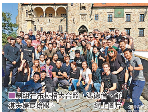
■ 劇組在布拉格大合照，馮德倫、舒淇夫婦最搶眼。