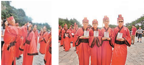
■由父親陪同兒子一齊行成人禮儀式甚有意義。

此次「泰山成人禮」活動較平日不同，因為團員除了年輕學生哥還有成年人，雖然大部分已經成年很久，但從未有機會行成人禮，今回多得有關方面通融，可一嘗行成人禮的滋味，一如老婆婆老公公金婚才補影結婚相。