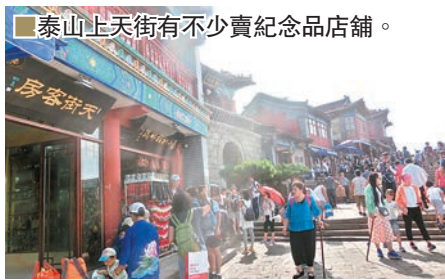
■泰山上天街有不少賣紀念品店舖。