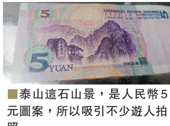
■泰山這石山景，是人民幣5元圖案，所以吸引不少遊人拍照。