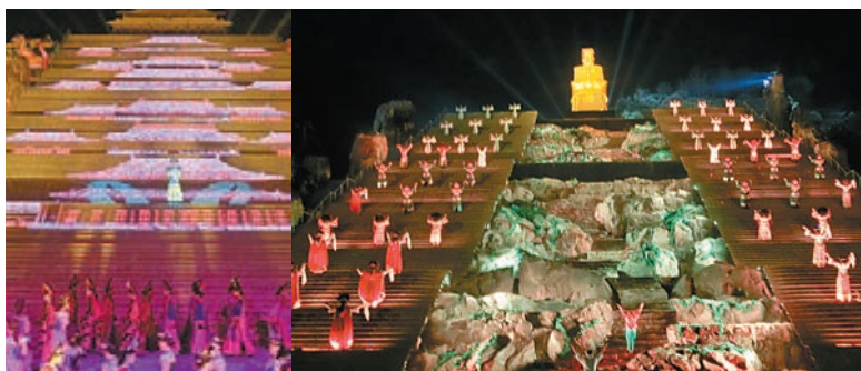
■大型史詩音樂劇《封禪》

幾千年來，泰山成為歷代帝王封禪祭天的神山，隨着帝王封禪，建廟塑像，刻石題字。留下岱廟、普照寺、王母池、經石峪、碧霞祠、日觀峰、南天門、玉皇頂等主要名勝古蹟。加上為五嶽之首，佛道兩家聖地，文人墨客紛紛登來，給泰山與泰安留下了眾多風雲人物；從司馬遷的名言：人固有一死，或重於泰山，或輕於鴻毛。又有到泰山壓頂不彎腰之名句；登臨泰山成為許多中國人的夢想。