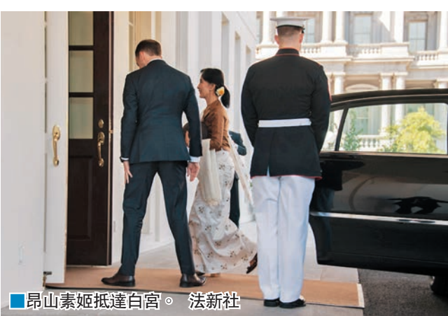
昂山素姬抵達白宮。