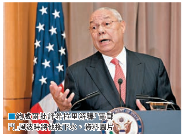
鮑威爾批評希拉里解釋「電郵門」風波時將他拖下水。