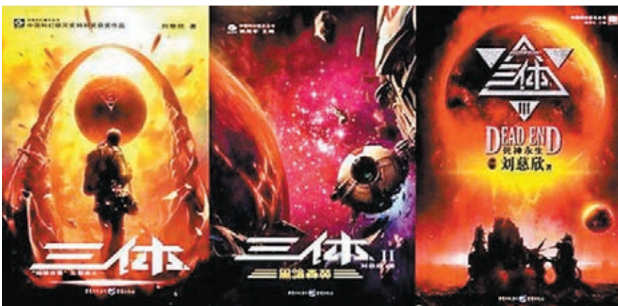
■劉慈欣的《三體》三部曲。

新華社電 從1904年中國首部原創科幻小說《月球殖民地小說》在《繡像小說》上刊載，到中國科幻作家一年內兩次斬獲雨果獎，中國科幻產業在百年中實現了令人振奮的發展。然而，業內人士在此間舉辦的「2016中國科幻季」上指出，中國科幻產業基礎相對薄弱，若要推動科幻產業的繁榮，必須培養出更多專業人才，推出更多有影響力的精品。 「我們的科幻創作人員還很匱乏，作品精品還太少，公眾對科幻關注度並不高，對科幻產業促進創新發展的重要性理解還不夠，產業鏈無法通過市場的手段有效連結，我們缺乏真正權威的、有影響力及號召力的、與國際接軌的科幻方面的平台和組織。」中國科學技術協會科普部副部長周世文說。 一個國家科幻產業的發展狀況可以通過出版和影視兩個主要指標來衡量。據科協數據顯示，中國每年出版長篇科幻圖書150至200種，大多為引進，國內原創篇幅僅40種左右，而美國每年出版科幻圖書達2,000種，原創率近70%。與此同時，中國科幻作家數量僅為200人左右，而美國有約2,000人。「在我國，科幻產業這個概念被正式提出不過是最近幾年的事。劉慈欣《三體》三部曲的最後一部在2010年出版前，我們的科幻產業基本處於雜誌時代，科幻的商業價值沒有被充分發掘，圖書出版領域缺少暢銷書。」科幻世界雜誌社副總編輯姚海軍說。 姚海軍指出，2010年後，中國科幻產業在還沒有完全從雜誌時代自然過渡到圖書時代的前提下，伴隨著爆發式的市場需求，突然現出遊戲、出版、動漫、影視並行發展的態勢。不過，導演、製片人阿甘認為，對中國電影人和電影製作來說，科幻題材是一個非常陌生的領域，要把科幻小說的成功案例轉化為影像方面的成功，短期內還是個摸索的過程，「這個過程會以很多作品的失敗為基礎。」雖然中國科幻產業面臨很多問題，各個方向的發育還不太完全，系統性不夠，但業內人士