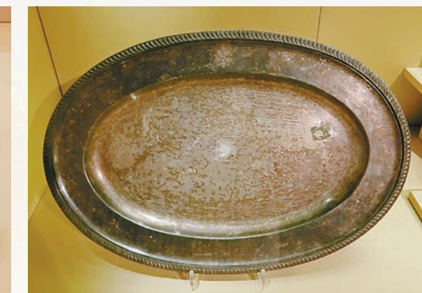
■溥儀使用的盤子，乃是日本訂製。