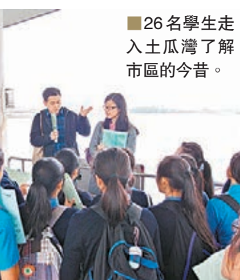
■26名學生走入土瓜灣了解市區的今昔。 文：Kat

(如劃房戶和天台屋)及少數族裔的情況，計劃的拍攝工作坊教授拍攝及採訪技巧。協恩中學的學生其後深入土瓜灣社區，訪問區內各階層人士，以錄像記錄他們的生活點滴，及對社區發展和轉變的看法，從而構思出他們理想中的土瓜灣，學生的影片就於明日活動中播放。街坊和市民可透過參與是次活動，於重建的當今享用他們的社區