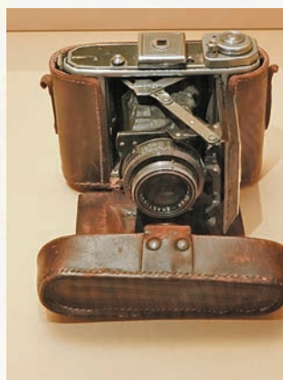
■溥儀使用過的相機。