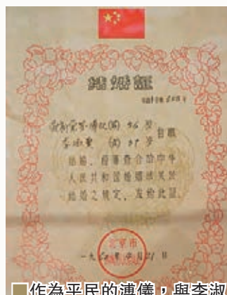
■作為平民的溥儀，與李淑賢結婚時的結婚證書。

犯，後來在中國接受改造。 在今次展覽中，有兩件展品特別引人注目。一個是溥儀當年在紫禁城大婚時，身穿的龍袍。當時溥儀雖然已經遜位，但是根據民國政府的優待條例，他仍然享有皇帝的尊號，居住在紫禁城。溥儀第一次大婚，皇帝派頭一點也沒有減少。另一個展品，是溥儀在1949年之後的結婚證明文書。此時的溥儀，已經是平民，準確地說，是公民。這兩件不同的展品，顯現出時代的變遷和滄桑。 從帝王的婚姻到平民的婚姻，不僅是中國歷史的轉變，也是文明的進步。溥儀恰好是這種進步的見證者。他的一位前皇妃，因為抗拒幽暗的生活，而在天津選擇與溥儀離婚，一時成為民國時代女性解放的代表。而作為正室的婉容，最終也難逃悲劇的下場。 時代的發展不可逆轉，從天子到公民，這是歷史的進步，也是不能夠倒退的潮流。溥儀滄桑的一生，便是這一時期的歷史寫照。