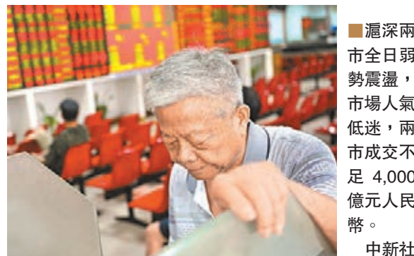
滬深兩市全日弱勢震盪，市場人氣低迷，兩市成交不足4,000億元人民幣。

石墨烯板塊大受熱捧，板塊升幅近6%。東旭光電8日推出全球首款石墨烯離子電池產品後，已連續飆升，昨日強勢封漲停。工藝商品、智能穿戴、蘋果概念、增強現實、水泥建材等也漲幅居前。園林工程、黃金水道、保險、上海自貿、中概概念則領跌。