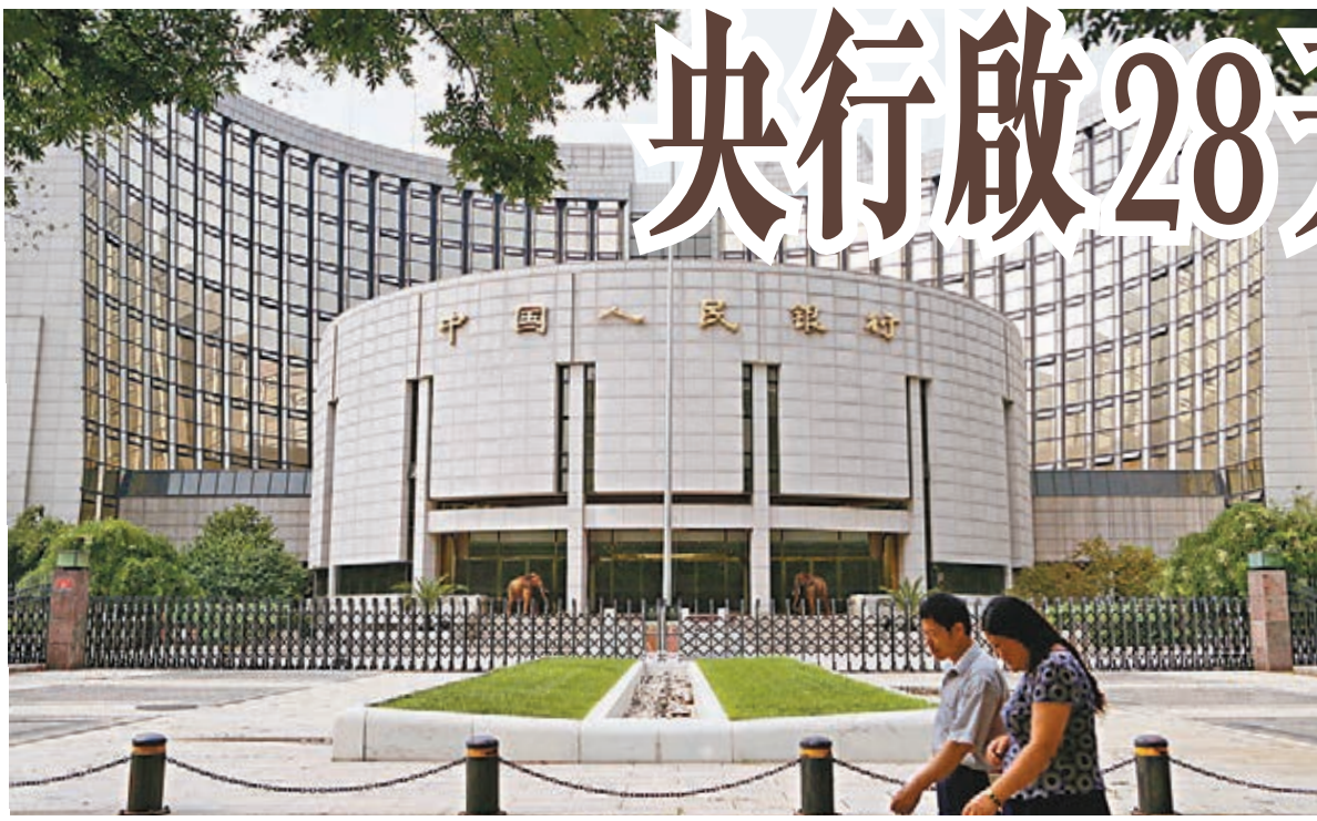
央行昨在公開市場進行28天逆回購，中標利率2.55%，同時還進行了700億元7天期逆回購操作，中標利率2.25%。