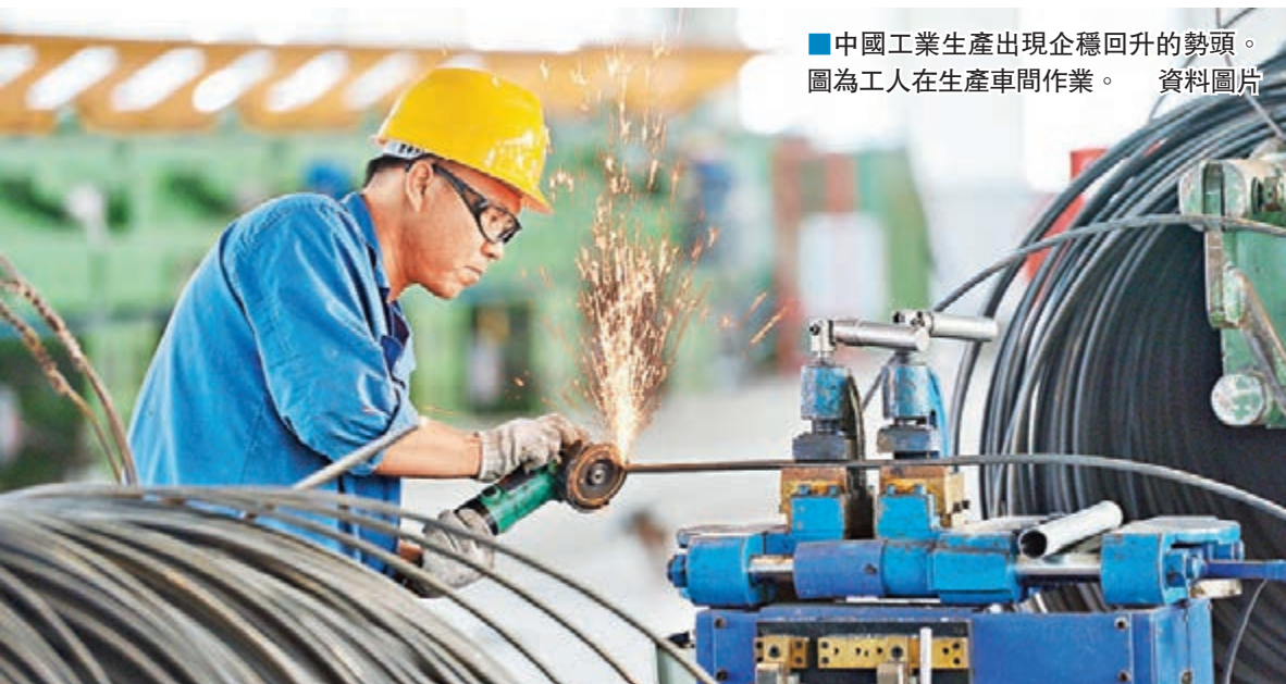
■中國工業生產出現企穩回升的勢頭。圖為工人在生產車間作業。

在宏觀政策方面，市場分析人士預計，下半年風險因素如美聯儲加息、對人民幣匯率的擔憂等仍存在，貨幣政策短期不會太快放鬆，財政政策仍會繼續「寬財政」，但由於地方投資消極，對經濟的拉動效果或有限。