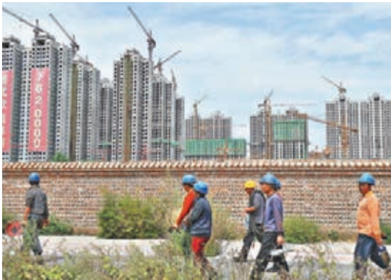
■數據顯示，1—8月份，房地產開發投資64,387億元，同比名義增長5.4%。圖為建築工人前往工地作業。

香港文匯報訊（記者 海巖 北京報道）國家統計局昨日發佈數據顯示，前8月房地產開發投資名義增速小幅回升，結束了此前連續多月的下降走勢，