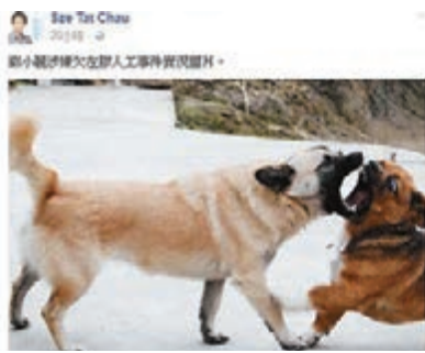
仇思達揶揄事件為「狗咬狗」。

聲明提到，該成員在今年1月多次了解「小麗老千」對支付薪金的態度，而「小麗老千」團隊另一成員曾提到：「小麗話傾吓先吓嘛，無再傾即係無囉，《蔓珠》有人知咩？」《蔓珠》強調，受聘乃非常清楚的事情，而且當中工作並無暫停，前期後製工作繼續由該成員一力承擔，更批評陳日東扭曲雙方協議，嘗試以工作能力人格謀殺該成員，實在可恥。 《蔓珠》直言，「小麗老千」至今仍未正面回應欠薪一事，其團隊更一直在外界抹黑該成員，指她有意打擊「小麗老千」的選情，遂呼籲「小麗老千」及其團隊停止抹黑他人、漂白自己，履行承諾及安守本分，不要未上任先做政棍，「更不要讓『自決派』的朱凱迪、羅冠聰等新任議員的聲望受拖累。」 「小麗老千」昨晨急忙澄清，並上載與該成員的對話截圖，附有入數紙圖片，企圖力證自己有出糧。她稱自己在去年8月提出向該成員支付4,000元人工，但有其他《蔓珠》理事會成員認為，不應有個別成員支薪，以免影響公平性，也要向該成員交代決定，而她與該成員的最後一次對話是在今年3月，「此後幾個月未有聯絡，我亦認為與成員A的交集暫時結束，因事忙未有再跟進。」她辯稱「事隔一年，大家各有各忙，對事情記憶有模糊也屬情理之中」，當中的矛盾導致互相不信任「令人唏噓」，仍希望與該成員商討事件云云。