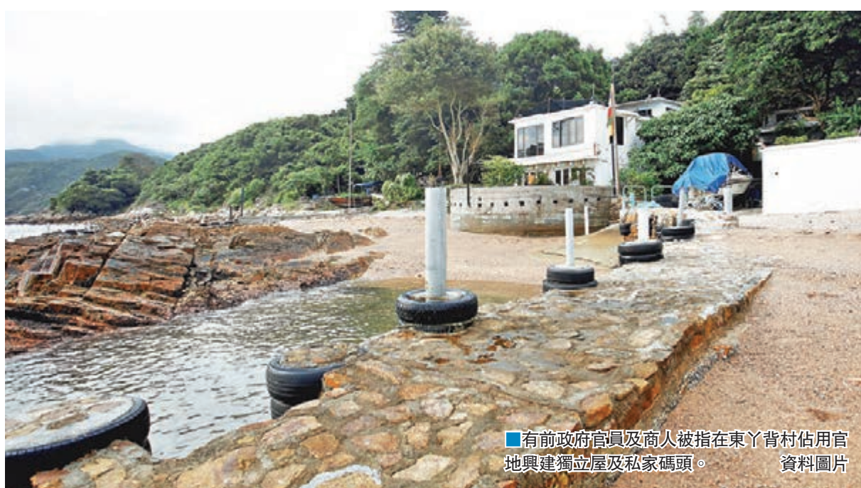
有前政府官員及商人被指在東丫背村佔用官地興建獨立屋及私家碼頭。

香港文匯報訊(記者翁麗娜)近年不時揭發有人非法佔用政府土地(佔地)及違反地契條款(違契),申訴專員公署主動調查發現地政總署採用規範化制度,而非主動打擊,導致時有違規情況。有新界村屋業主非法霸官地經營露天茶座,政府拖延近廿年才執法,其間竟沒有收取分毫。公署不接受地政總署以「資源不足」為解釋理由,建議至少要主動抽查,並向申請短期租約或豁免的人收取「暫准費」,杜絕違規者「零成本」霸地。