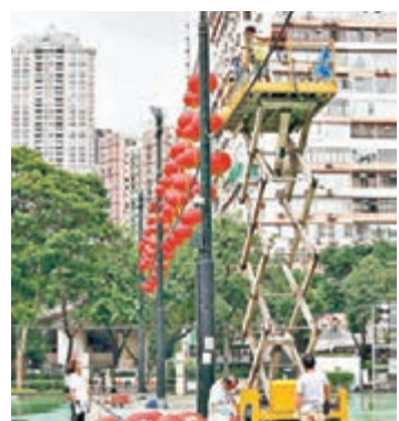
莫蘭蒂逼近華南,中秋節將有狂風驟雨,市民或許未能觀賞月色及維園彩燈。