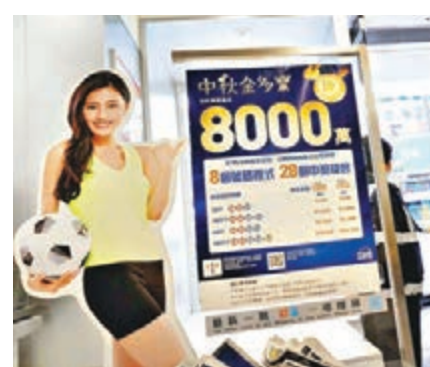
昨晚攪珠的中秋金多寶,頭獎彩金高達8,000萬元。

香港文匯報訊(記者文森)令全城瘋狂的8,000萬元中秋金多寶六合彩昨晚揭盅,共吸引逾1.73億元投注額。結果攪出號碼為1、13、19、21、38、49號,特別號碼23號,頭獎1.5注中,每注派約5,563萬元。此外,二獎多達11注中,每注派逾71萬元;三獎330注中,每注派63,130元。下期攪珠於明晚9時30分舉行,頭獎基金為800萬元。