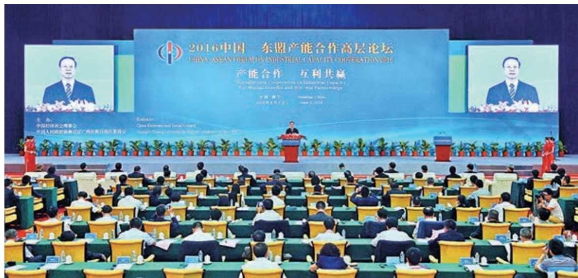
■12年來，超過700家企業借助東博會投資合作平台，開拓了與東盟產能合作的市場。