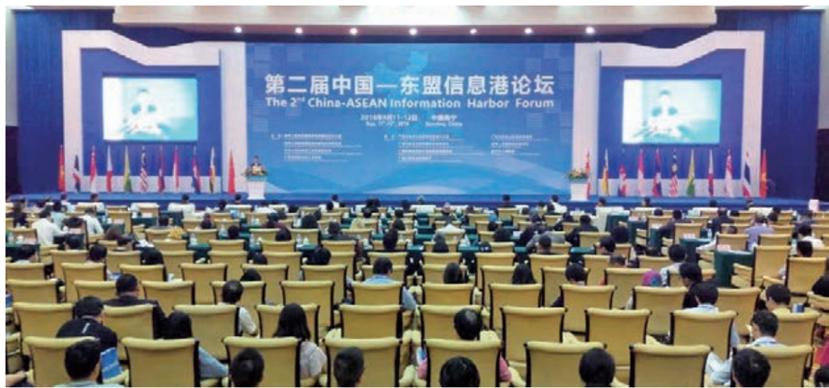
■第二屆中國—東盟信息港論壇在南寧開幕。