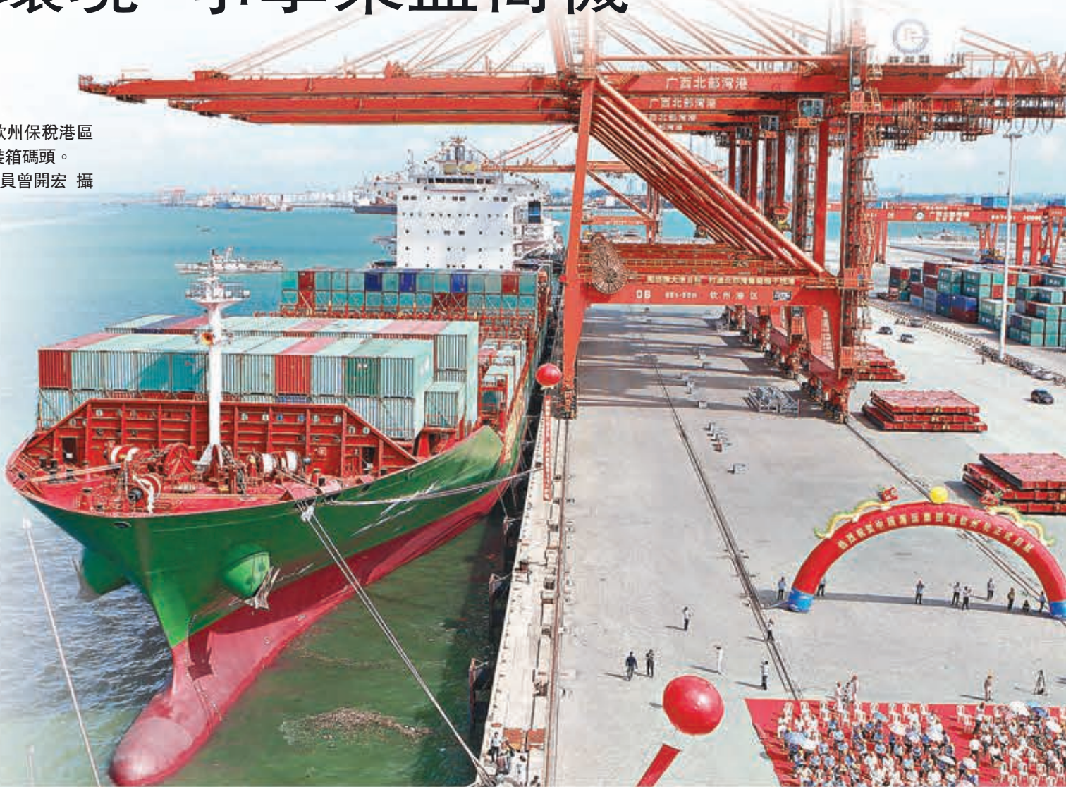
廣西欽州保稅港區國際集裝箱碼頭。