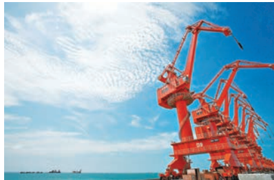
北海鐵山港碼頭。資料圖片

何潮南說，還保留在上世紀90年代初期生產設備和銷售模式的港企，現在是時候西進北部灣。他以為自己為例，儘管還在佛山保留着年產50萬噸的廠區，但北海廠區的規模已經是其六倍。他認為，誠德在北海的發展歸功於北部灣港的區位優勢，海運費用僅物成本節省一項，已是公司一大筆收益。