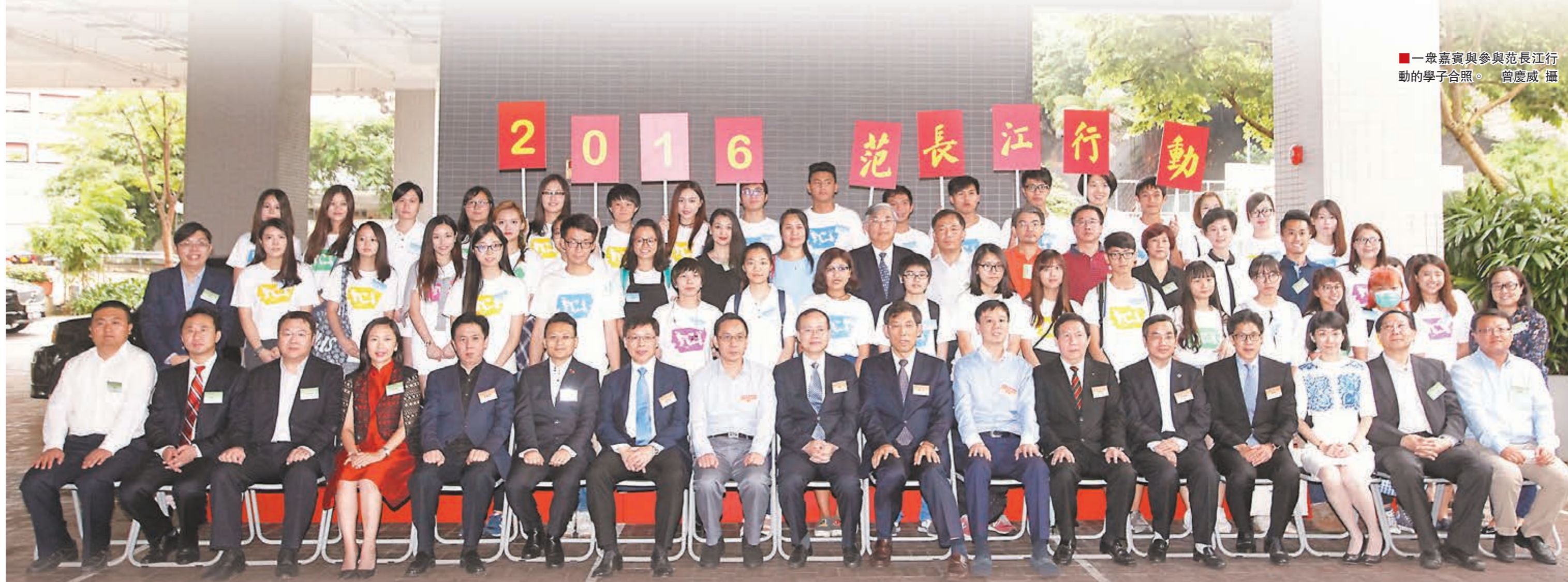
一眾嘉賓與參與范長江行動的學子合照。