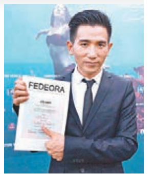
■導演趙德胤在威尼斯影展中樂透一展領下榮耀。

香港文匯報訊 威尼斯影展前晚宣佈《再見瓦城》奪下歐洲電影聯盟大獎最佳影片,導演趙德胤親自領下這份榮耀,而已經回到台灣的柯震東、吳可熙,得知訊息也相當開心。 趙德胤前晚親自上台領獎,感謝威尼斯影展的肯定,特別感謝男女主角柯震東、吳可熙,形容他們是「很專業又很努力拚命的演員」,很開心他們的表現能夠被看見,希望與他們一起分享這個