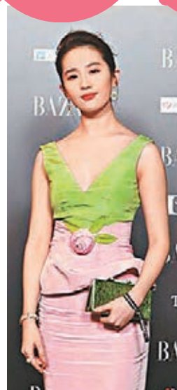
■劉亦菲罕有性感示人。