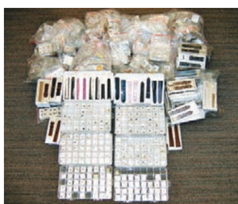
海關在會展一個展銷攤位檢獲大批懷疑冒牌手錶零件。

據悉海關正設法了解有關零件來歷。貿發局發言人表示，鑑於案件已進入司法程序，不作評論。