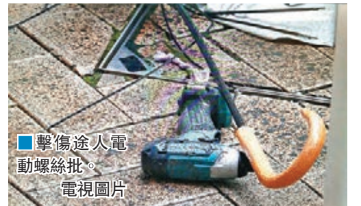
擊傷途人電動螺絲批。

香港文匯報訊(記者 杜法祖)深水埗富昌邨昨險釀高空墮物殺人事件，一名身穿印有房屋署標誌衣服的工人，疑在樓上單位外牆進行維修期間失手，一把重約數磅的電鑽形電動螺絲批跌落樓，當場擊中一名男途人，所幸事主當時因大雨打傘，雨傘卸去部分衝力，惟仍頭部受傷須送院救治，警方事後拘捕肇事工人扣查，房屋署則表示會跟進了解情況。