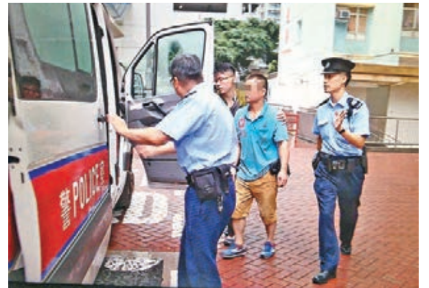
涉天降電動螺絲批擊傷途人的維修工人被帶署調查。