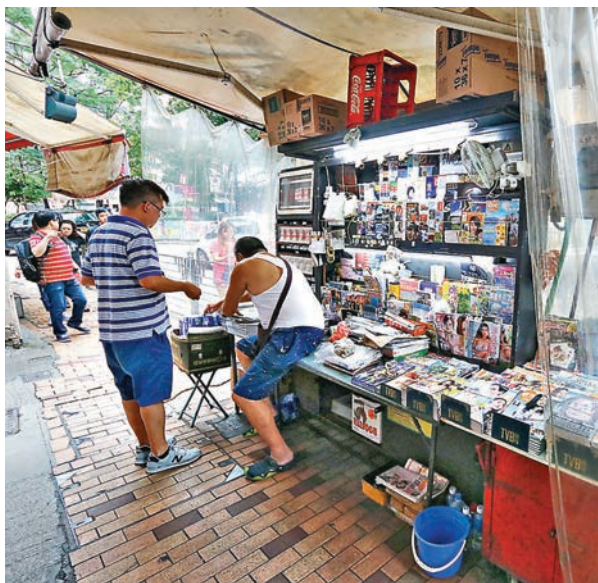
遭爆竊報檔被偷去大批香煙。

香港文匯報訊(記者 杜法祖)筲箕灣東大街昨晨揭發連環爆竊案，一間報紙檔及兩間食肆在2個多小時內先後發現遭人爆竊，其中報紙檔被掠去30條香煙，總值1.56萬元，女報販一度慨嘆「唔知做幾耐先賺得返」。另外兩間食肆則遭人破壞電動捲閘的電箱闖進爆竊，合共遭掠去1萬元現金，警方初步不排除3宗案件均為同一幫竊匪所為，刻下正設法緝捕歸案。