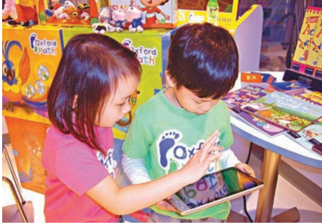
■衛生署建議大眾使用屏幕產品時，眼睛應與屏幕保持適當距離，智能電話最少要有30厘米，電腦則最少50厘米，將不良影響減至最低。資料圖片

香港文匯報訊（記者 姜嘉軒）本港電子產品普及率全球領先，很多家長為避免孩子「扭計」及打擾，會將智能手機、平板電腦等當成「電子奶嘴」，讓子女專注「打機」了事。衛生署調查指出，兒童開始使用平板電腦的年齡中位數竟不足歲半，港大的研究亦初步證實，愈早使用電子產品的兒童，患過度活躍症的風險愈高，而過度使用電子產品的兒童睡眠質素較差、影響社交表現，甚至學業成績，後患無窮。