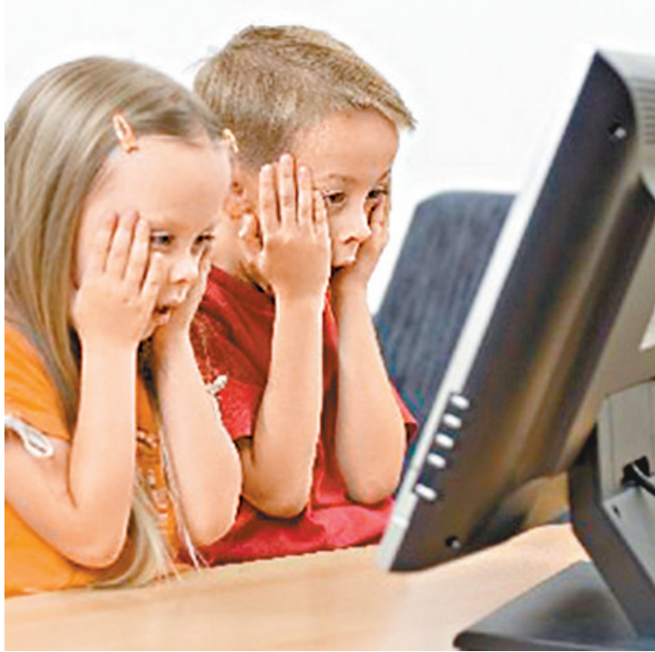
■港大研究發現愈早使用電子產品的兒童，愈高風險患過度活躍症。資料圖片