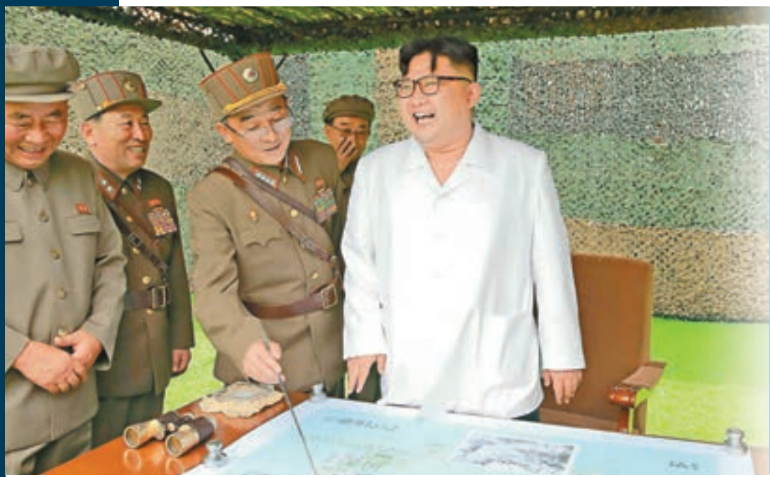
朝鮮進行歷來第5次核試。圖為領導人金正恩。資料圖片

朝鮮東北部於昨晨發生一次強度達黎克特制5.3級的「人為地震」，韓國政府表示，相信朝鮮在豐溪里核試場進行第5次核試。