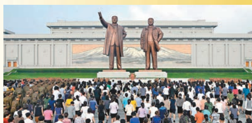
金正恩選擇在朝鮮國慶日核試。圖為朝鮮慶祝國慶。

有提振國內士氣的考量。造成5級震感的核爆已很嚴重，金正恩不願國際社會反對連續核試，肯定會引來新一輪嚴厲制裁。核試對中國邊境地區水質、大氣帶來的潛在影響，也定會引起中國邊境民眾的不滿和擔憂。