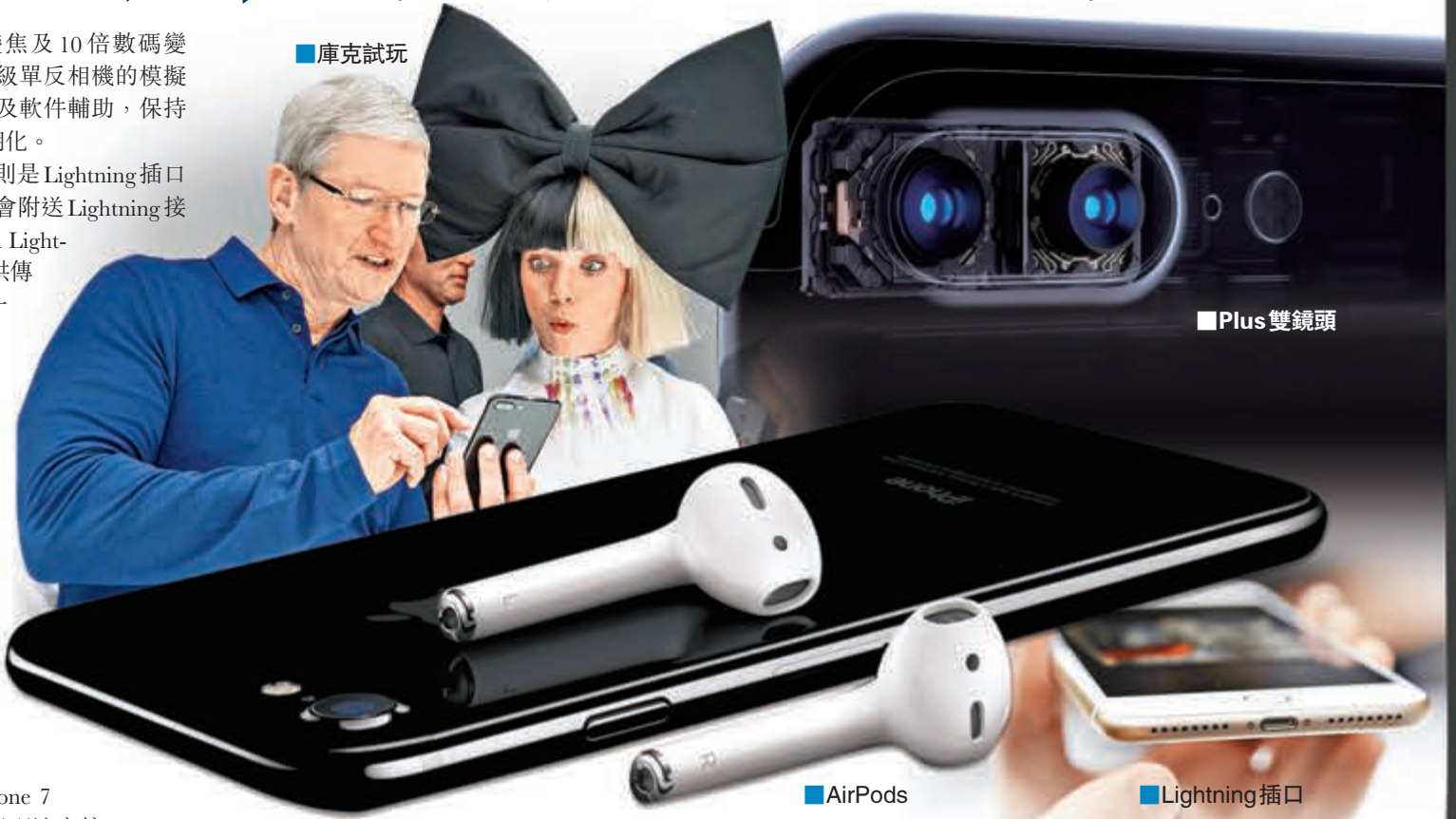
■ Plus 雙鏡頭