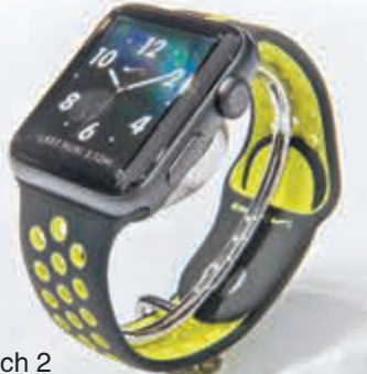
■ Nike 版 Apple Watch 2

Watch 2 售價由 3,088 港元起，仍然分銀色、金色、太空灰及玫瑰金 4 色。蘋果亦與 Nike 和 Hermes 合作，推出特色運動錶帶及豪華皮革錶帶，後者售價最高為 12,088 港元。