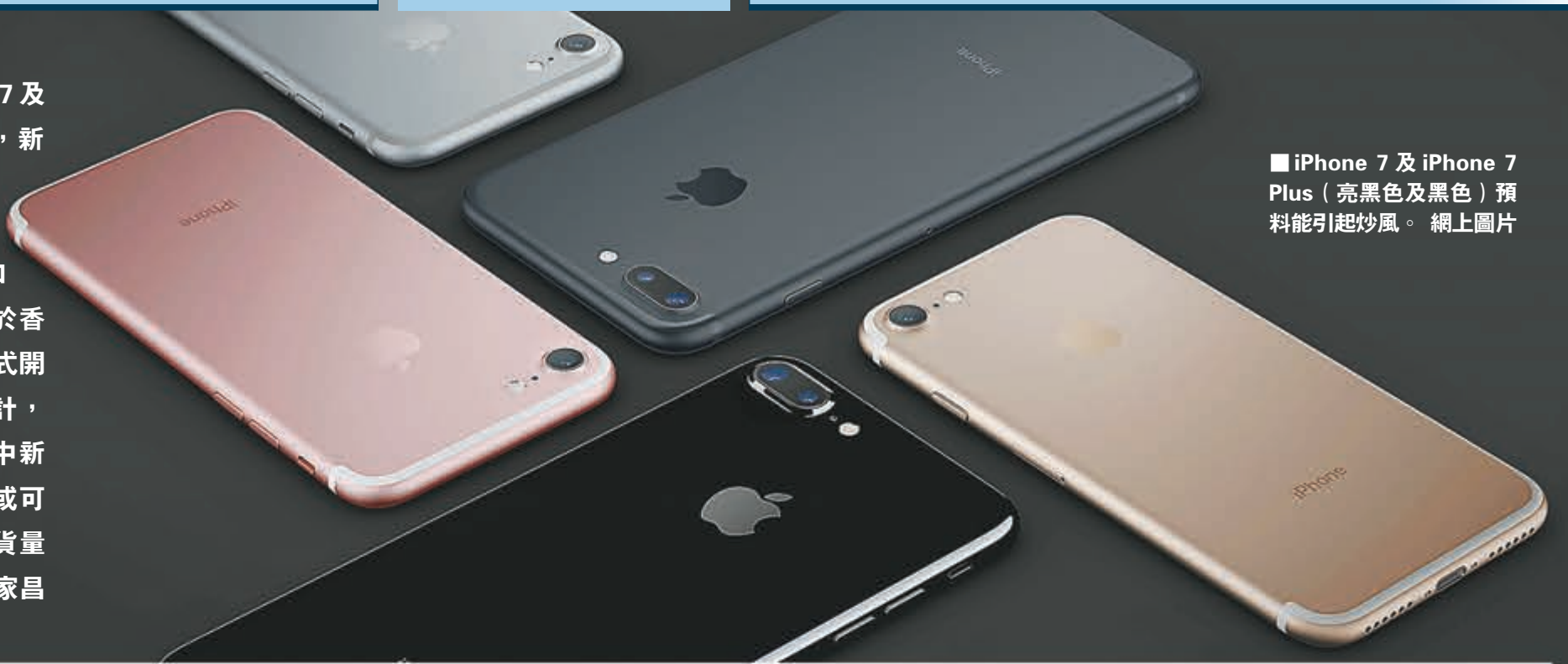
■ iPhone 7 及 iPhone 7 Plus (亮黑色及黑色) 預料能引起炒風。

蘋果公司最新智能手機 iPhone 7 及 iPhone 7 Plus 昨日凌晨正式發佈，新機規格與事前傳聞基本一致，例如兩款新顏色、雙鏡頭及防水功能等，全面取消 3.5mm 傳統耳機插口的評價則仍是毀譽參半。新機將於香港時間今日下午 3 時在蘋果網站正式開放預訂，下周五出貨。有炒家估計，個別新機款式應該能夠炒起，當中新顏色亮黑色的 iPhone 7 Plus 首日或可賺 3,000 港元，但炒多久則視乎供貨量而定。 ■香港文匯報記者 余家昌