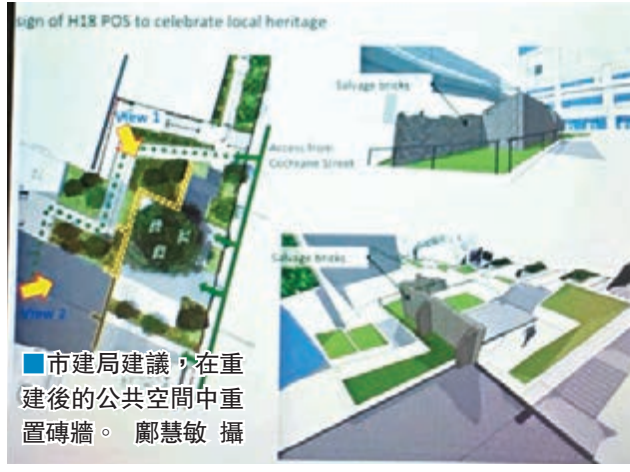
市建局建議,在重建後的公共空間中重置磚牆。

香港文匯報訊(記者 鄭慧敏)屬於市區重建局的中環卑利街/嘉咸街重建項目範圍的閣麟街,內有逾百年歷史的「背對背」唐樓群磚牆遺蹟。古物諮詢委員會昨日推翻早前決定,通過重新為該遺蹟進行歷史評級。市建局昨日亦向古諮會介紹保育磚牆的方案,計劃將磚牆拆除,在重建後的公共空間重置磚牆。有民間關注組織卻批評,方案未能呈現遺蹟背後的歷史意義,希望能夠原址保育。