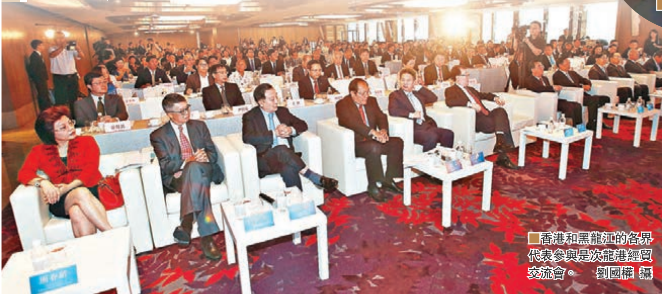
香港和黑龍江的各界代表參與是次龍港經貿交流會。

香港文匯報訊(記者 周曉菁)黑龍江省政府昨日在港舉辦「2016黑龍江省(香港)經貿合作交流會」,吸引到大量港企參與。副省長李海濤在致辭時表示,中央密集出支持東北振興政策,且高度重視黑龍江的振興發展,「當前加強龍港合作恰逢其時,機會難得」。他認為,基於政策支持和區位條件,該省可在資本運作等現代金融領域、大數據等信息服務領域,以及陸海絲路帶建設領域等總共十個方面,與香港各界展開合作。