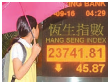
港股昨結束4日升市,輕微回吐45點,成交略為增至803億元。 中通訊