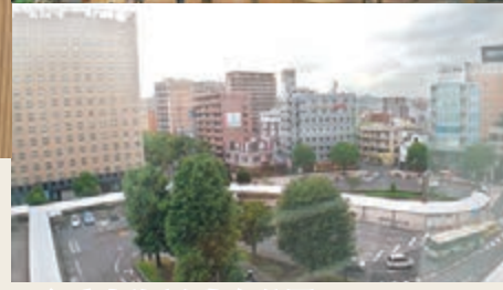
■ 酒店處於交通樞紐位置