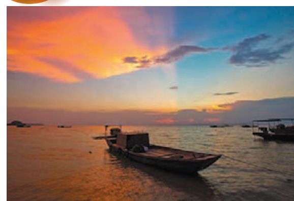
雲蒸霞蔚 江西鄱陽湖都昌水域上空雲蒸霞蔚，呈現七彩雲霞的美景，絢麗的火燒雲映襯着湖面，宛如畫卷。