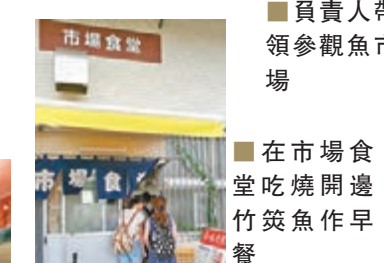
■ 在市場食堂吃燒開邊竹筴魚作早餐