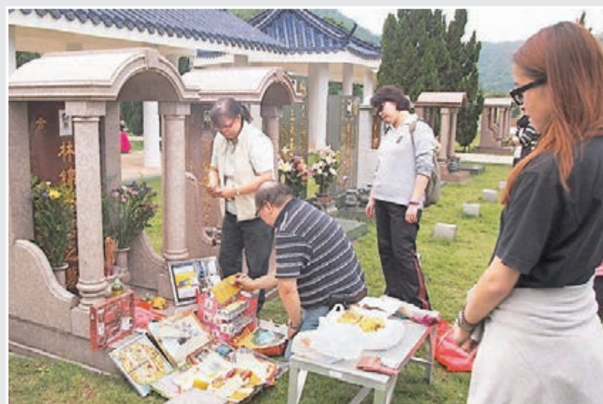
■本港的墓地和骨灰龕位嚴重供不應求。

題目屬於立場題，學生需就題目建立自己的立場，並利用不少於三個論點以比較網絡祭祀較傳統的祭祀何者較配合香港情況，而要取得高分，亦需於末段進行駁論。學生亦需留意題目中的關鍵字詞，回答時需要緊扣「香港的情況」，不止於比較網絡祭祀較傳統的祭祀模式。