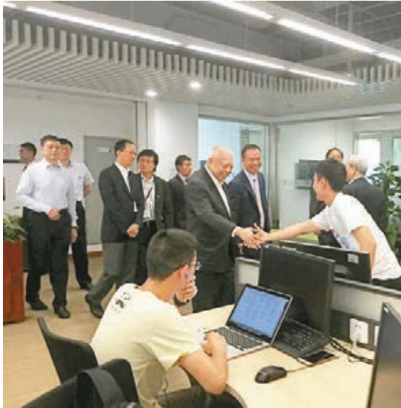
董建華與學生交流。