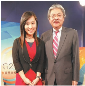
曾俊華接受鳳凰衛視特派記者黃芷淵專訪。

全球注目的二十國集團領導人峰會及工商峰會前日在杭州落幕，以中國代表團成員身份出席會議的香港特區財政司司長曾俊華於峰會結束後，接受鳳凰衛視獨家專訪時指出，國家愈來愈開放是好事，對香港來說也是優勢，因為香港主要是服務型經濟，其中93%本地生產總值都與服務有關，因此當國家開放愈多，香港新機會愈多，「所以我們相當期望國家再進一步開放。」