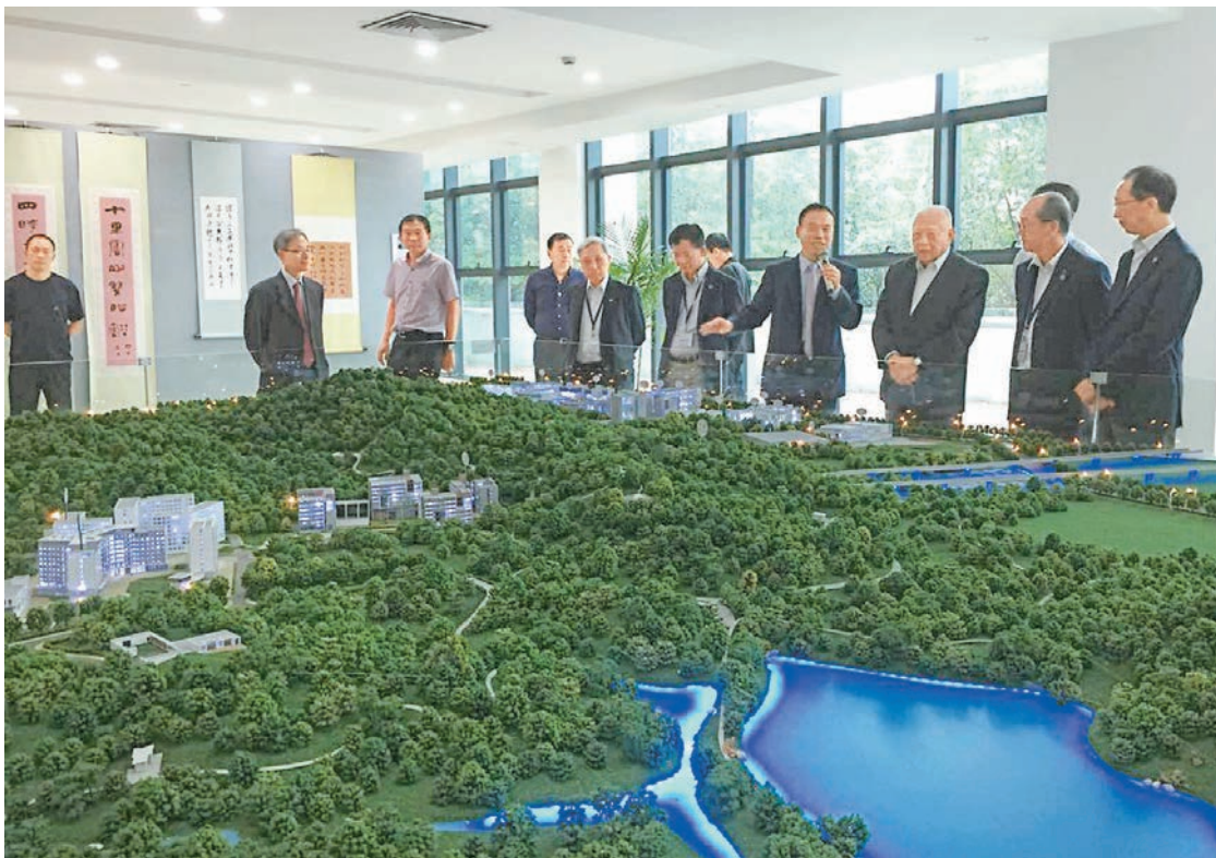
董建華訪問港中大（深圳）。

港中大（深圳）目前一年學費9.5萬元，費用不菲。為保障清貧學生入讀機會，校方於2016年向100餘名本科新生提供入學獎學金，其中21人來自中西部偏遠山區或貧困地區的學生，他們獲得4年共計420多萬元的助學金。徐揚生表示，希望深港慈善企業家多關注該校，捐資助建。