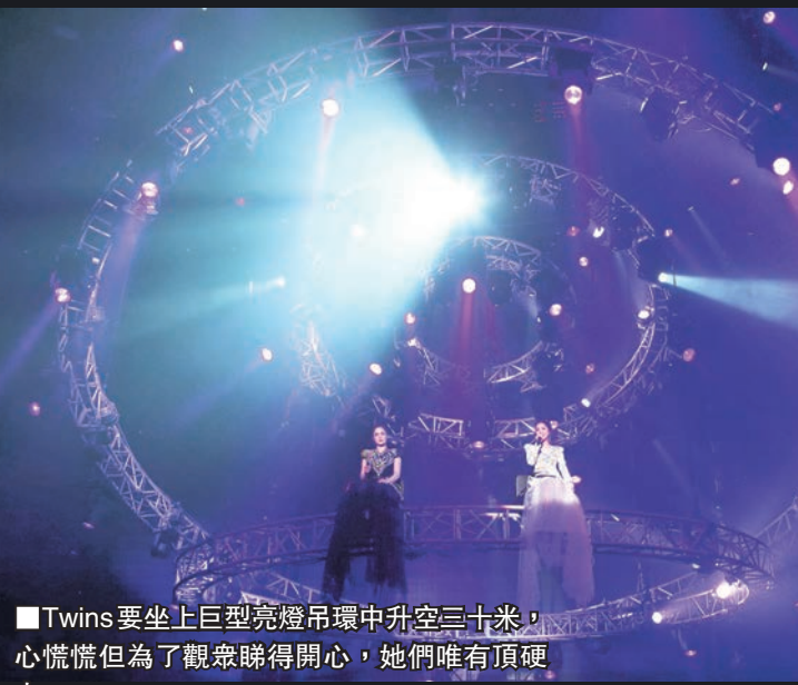
Twins要坐上巨型亮燈吊環中升空三十米，心驚慌但為了觀眾睇得開心，她們唯有頂硬

香港文匯報訊「TwinsLoL世界巡迴演唱會」前晚於深圳舉行，全場萬多座位一早爆滿，歌迷由開場一起大合唱到完場，唱到最後快歌部分更不理公安勸喻，全場站立起身跳舞，氣氛沸騰到頂點，蔡卓妍(阿Sa)和鍾欣潼(阿嬌)兩人被觀眾之熱情打動，於台上當眾嘴對嘴擁吻報答觀眾。