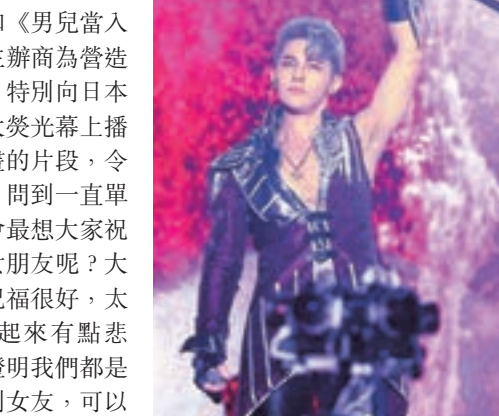
汪東城希望找個女朋友好好拍拖。

香港文匯報訊(記者植毅儀)大東(汪東城)前晚特地來港到九展舉辦《次元男男女女汪東城演唱會》歌迷聚會，順便慶祝上月24日的35歲生日。由於他是一位超級動漫迷，所以今次特別把主題名為「次元男男女女」。今次的歌迷聚會以小型音樂會形式進行，更集合了中港台各地粉絲。這次歌迷聚會是由內地的網絡公司贊助，所以同時亦在內地作全國直播。大東在歌迷聚會用日語唱了多首經典動漫歌，包括