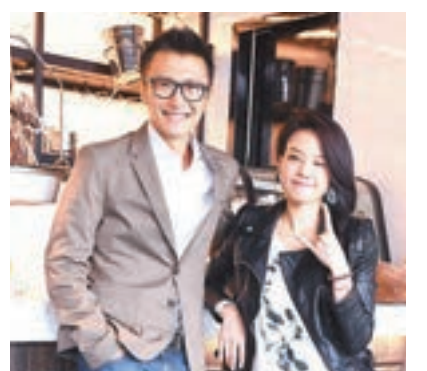
舒淇與謝霆鋒於台灣的田野鄉間拍攝。