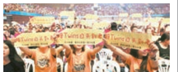
歌迷高舉着「陪Twins白頭到老」的手幅，Twins見到大為感動。

幅，Twins見到也大為感動，阿Sa於台上說：「十五年的日子，雖然當中都有經過風雨，但呢個係人生，人生一定有風雨嘍，多謝大家支持吃我們十五年，係咪真係陪我們白頭到老呀？不過我估我們老咗都唔會白頭，哈哈，因為我一定忍唔到白髮，我會去染，哈哈。」