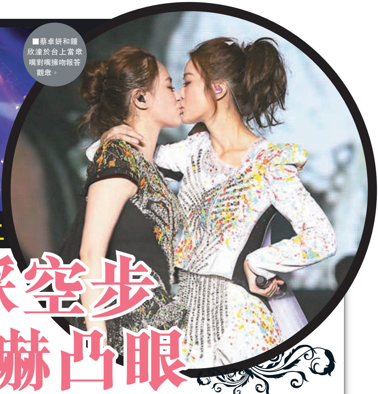
蔡卓妍和鍾欣潼於台上當眾嘴對嘴擁吻報答觀眾。