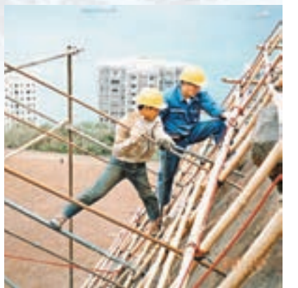
■ 按行業劃分的就業不足率中，運輸業達到1.4% (左)，建造業更達6.1% (右)。 資料圖片

香港經歷多次的經濟轉型，與國際局勢的演變有相當密切的關係：香港的地理優勢使其從漁港發展至轉口港，其後因為韓戰，內地實施經濟封鎖，以致大量勞動人口、資金及技術湧入香港，促使香港發展工業城市。香港由工業社會再轉型，亦與全球化下內地政策轉變有關：內地實施改革開放後，其廉價的租金及勞工成本，吸引香港廠商將生產工序大量向珠三角一帶轉移，故香港的工業漸漸式微，走向知識型經濟。經濟全球化對香港帶來的挑戰：