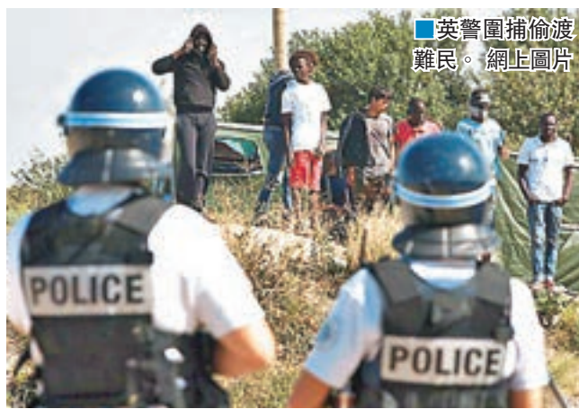
■英警圍捕偷渡難民。