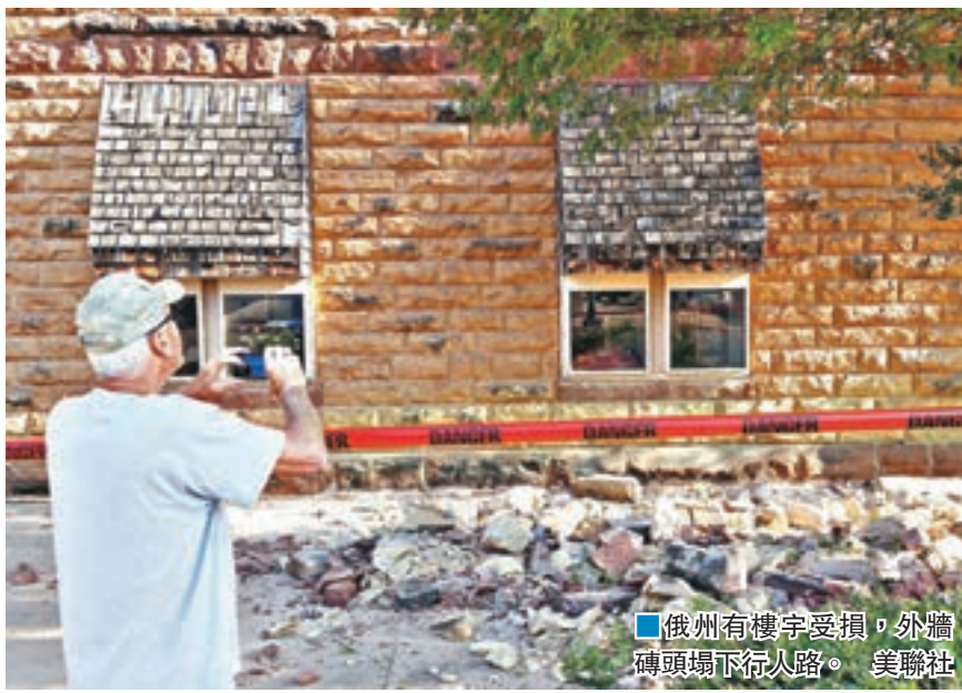
■俄州有樓宇受損，外牆磚頭墜下行人路。

美國主要頁岩油氣產地的俄克拉何馬州中北部，前日早上7時2分發生黎克特制5.6級地震，是該州歷來最強地震，強度追平2011年11月發生於同一地區的地震，遠至伊利諾伊州及得州西南部亦感受到震動。今次地震再次令外界關注油公司開採頁岩時向地底傾注污水，可能引發地震的問題，州政府更即時下令震央附近37個污水井關閉。