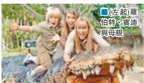
■(左起)羅伯特、賓迪與母親

澳洲「鱷魚先生」歐文2006年拍攝節目時被魔鬼魚刺中心臟死亡，昨日是他的10周年死忌，澳洲各界均再次向這位環保人士致敬，他的兩名子女亦承諾要繼承父志，繼續推廣保護野生動物。