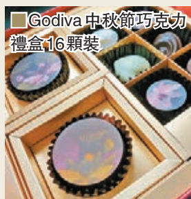
Godiva中秋節巧克力禮盒16顆裝

中秋將至，人月兩團圓，近年除了傳統月餅外，不少巧克力品牌都推出巧克力月餅系列，例如GODIVA中秋巧克力特選多款果香清幽的水果，不同組合配搭的水果與馥郁醇香的巧克力融合，締造出四款全新口味，栩栩動人的荷花圖案綻放在巧克力打造的外殼之上，如蘋果櫻桃黑巧克力月餅、李子石榴牛奶巧克力月餅、紅莓山竹迷你黑巧克力月餅及香橙紅莓迷你牛奶巧克力月餅等。同時，品牌亦精心挑選口感豐盈的果仁融入絲滑巧克力醬之中，與綿密的巧克力蛋糕巧妙疊搭，巧克力外殼上特意勾勒上荷花圖案，如海鹽榛果牛奶巧克力蛋糕月餅、紅莓黑巧克力蛋糕月餅、香脆果仁牛奶巧克力蛋糕月餅及杏仁黑巧克力蛋糕月餅等，帶來與眾不同的味蕾新體驗。