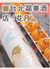
台北晶華酒店「花月」

而澳門美高梅則自家製限量「迷你朱古力月餅」，朱古力夾心內餡質軟滑細膩，共有三款不同的創新口味：黑蒜豆奶口味，選用擁有「黑鑽石」美譽的黑蒜頭製作，新奇的食材搭配別出心裁；蜂蜜迷迭香口味，