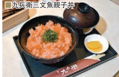
九兵衛三文魚親子丼

除了「九兵衛三文魚親子丼」，餐廳更將陸續獨家帶來其他人氣限定丼物，包括九州大分縣「豐之屋」的「大分雞肉天婦羅丼」及中部愛知縣著名雞料理專門店「鳥開」的「名古屋親子丼」。同時，餐廳於黃埔再開設新一代分店，為食客提供悠閒舒適的用餐環境及加入了洋風元素的和食，如前菜、輕食、丼飯、讚岐烏冬，以至特色飲品及甜品等，款式