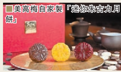
美高梅自家製「迷你朱古力月餅」

用上酒店自家栽種的有機香草，並以蜜糖襯托出其獨特的芳香，味道甜而不膩，清新可口；櫻桃黑朱古力口味則以70%濃度的精選黑朱古力，味道微甘，再配以溢滿酸甜果香的車厘子，口味層次豐富。