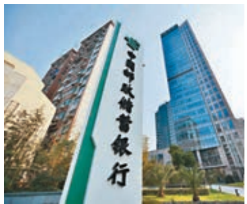
中國郵政儲蓄銀行將於下周一一起路演,19日定價。

香港文匯報訊(記者 陳楚倩)港股近期向好,吸引愈來愈多公司擬來港上市。市場消息指,中國郵政儲蓄銀行計劃本月28日掛牌,集資最多100億美元(約780億港元),有望成為今年最大型新股。該行將於下周一一起路演,19日定價,估值550億美元(約4,290億港元)。