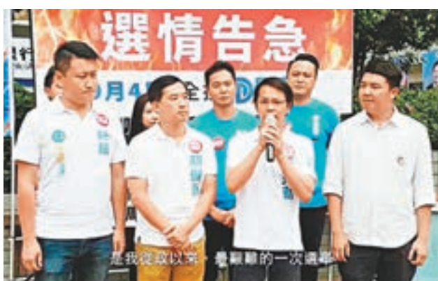
陳克勤在fb發佈選情告急的宣傳短片。

陳克勤一直為市民爭取公義,獲得不少支持。藝人陳錦鴻在一段視頻中表示,陳克勤這四年在議會盡心盡力工作,成績有目共睹,又指如果大家想香港好,繼續安定繁榮,便要在明日投票支持他。