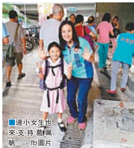
連小女生也來支持葛佩帆。 fb圖片

香港文匯報訊(記者 文森)香港的未來將會如何,沒有人說得準,但可以肯定的說,倘目前的亂局持續,經濟再差下去,香港的前景不容樂觀。民建聯新界東候選人葛佩帆昨日希望,暴力及「港獨」不要入侵校園,更不要教孩子去搞什麼「流血革命」。為了下一代,她會努力建設香港,希望大家投票支持她。