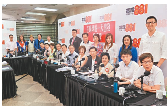
候選人出席電台的立法會新界東選舉論壇。