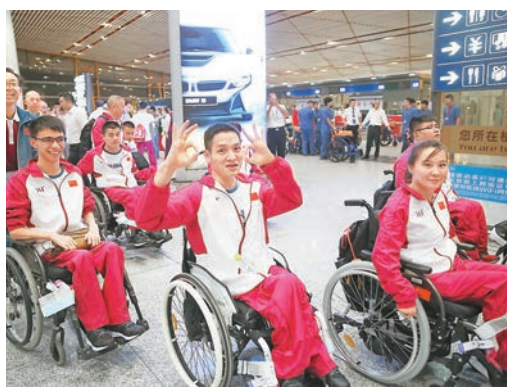
中國殘奧代表團已經飛抵里約。新華社

的殘疾人運動員個個精神振奮,我們要向他們學習,學習他們樂觀的人生態度和為國爭光的精神,把他們的精神帶到我們的日常工作中。」 ■新華社