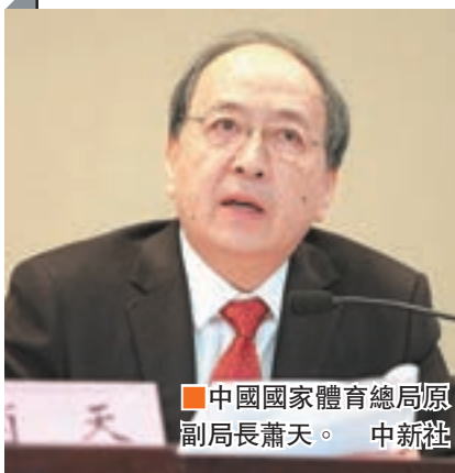
中國國家體育總局原副局長蕭天。

織調查。2016年6月3日,據最高人民檢察院官網消息,國家體育總局原副局長蕭天涉嫌受賄一案,由最高人民檢察院指定河南省人民檢察院偵查終結後,移送河南省南陽