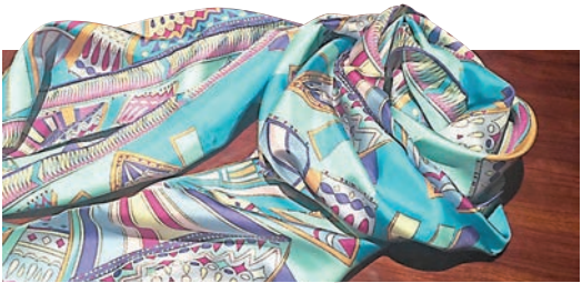
作為禮品贈與與參會記者的杭絲。

此外,境外記者入住的酒店方還精心挑選了「蕭山花邊」作為入住禮物。直接用線編結挑繡花邊的蕭山花邊又稱蕭山萬縷絲,這一工藝是在歐洲中世紀民間刺繡的基礎上發展起來的一種抽紗刺繡。1972年,為迎接美國總統尼克松訪華時,蕭山花邊廠就為杭州機場貴賓室繡製了高達6米,寬18米,用線12萬支(約10公斤),手工挑繡達3,000多萬針的大型西湖全景窗簾。