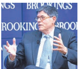
美財長雅各布·盧

對於即將在杭州舉行的G20峰會,盧表示,美國總統奧巴馬將在峰會上呼籲各成員利用各種政策工具,尤其是財政政策和結構性改革來支持世界經濟實現更強勁、更具包容性的增長。他還表示,美國在峰會上將支持開放、融合的全球經濟發展。