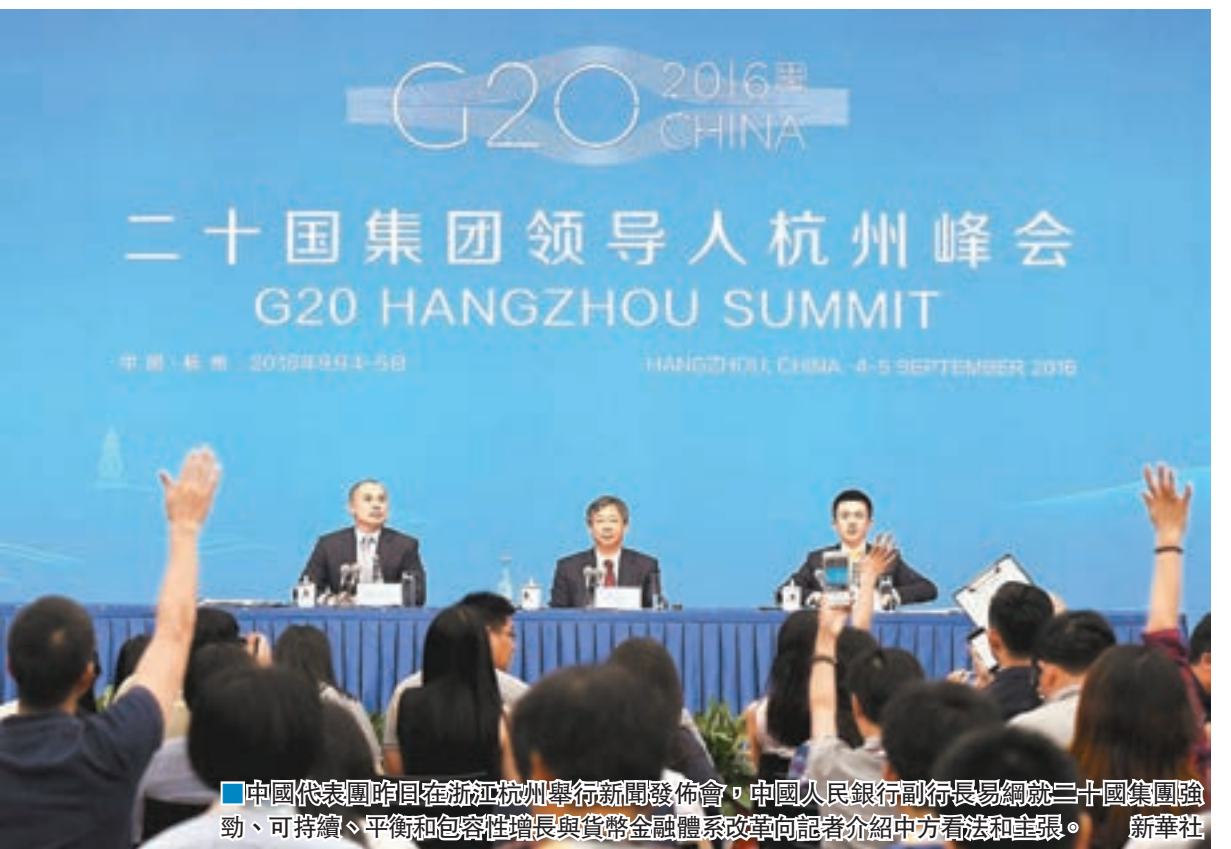
中國代表團昨日在浙江杭州舉行新聞發佈會,中國人民銀行副行長易綱就二十國集團強勁、可持續、平衡和包容性增長與貨幣金融體系改革向記者介紹中方看法和主張。新華社

談到各國當下的匯率政策,易綱表示,匯率對實體經濟產生一定影響,最好是保持合理均衡。G20的共識就是不以競爭為目的來貶值貨幣,各方將就匯率市場展開更緊密的溝通協調。