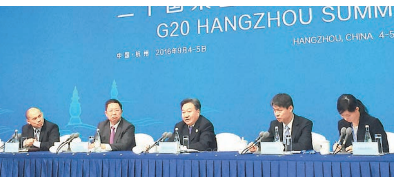
2016年二十國集團工商界活動(B20)新聞發佈會昨日在杭州舉行。本報杭州傳真

據悉,對於參與B20峰會企業的選擇主要有兩個標準,一是積極、長期參與B20的進程推進,對於有參與議題工作組討論的企業會優先考慮;另一方面就是有實力、有行業代表性的企業,因為只有這樣的企業才能真正代表工商界。