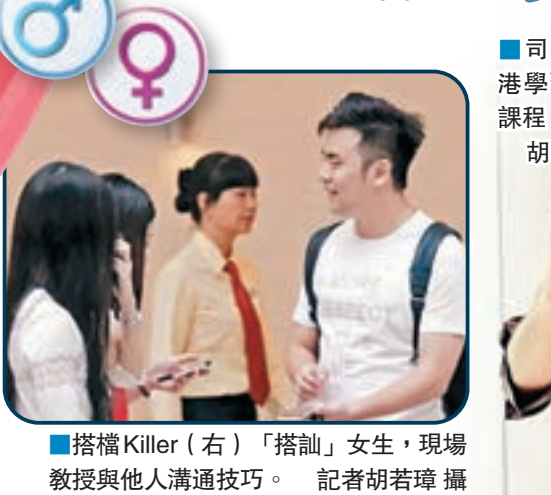
搭檔Killer(右)「搭訕」女生，現場教授與他人溝通技巧。

隨着網絡文化興起，身邊的宅男、宅女日益增多。現實生活中，他們在與人交流、交往方面普遍存在一些障礙。近期，在香港接受過「搭訕」培訓的廣州青年，將流行於歐美國家社交文化的PUA理論帶回廣州。以培訓宅男社交技巧為己任，平均教學收費一期3,500元(人民幣，下同)左右，短時間內即賺到20萬，讓他們感歎都市戀愛有套路，市場潛力也龐大。 香港文匯報記者 胡若璋 廣州報道