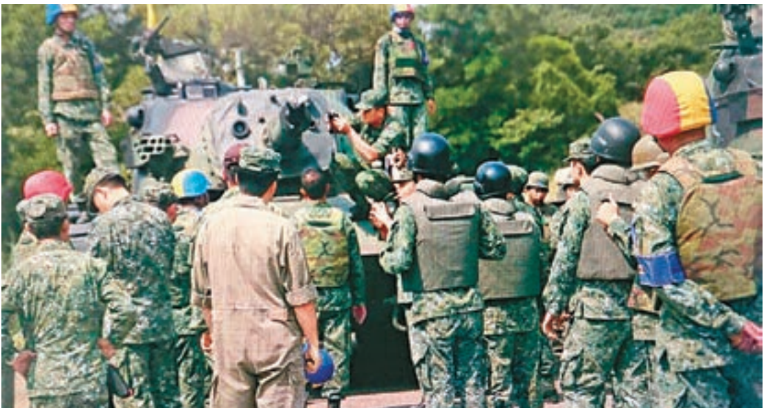
CM11「勇虎式」戰車再出事故，所幸未造成傷亡，軍方已決定全面停用檢測。

香港文匯報訊 綜合中央社、中通社及東森新聞報道，繼日前漢光演習預演發生翻覆意外致4死1傷慘劇後，台軍方主力戰車——CM11「勇虎式」戰車昨日再出事故，1輛戰車砲管不明原因斷裂，所幸未造成傷亡，軍方已決定全面停用檢測。