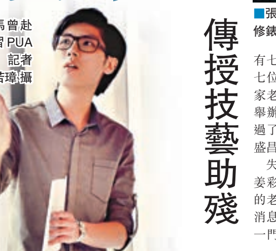
司馬馬赴港學習PUA課程。

據悉，PUA(Pick-Up Artist)翻譯成中文即是「搭訕藝術家」，大都是一群熱衷於分享社交經驗的網絡人群，他們收費傳授社交術。如今，PUA導師也在廣州應運而生。在這些導師眼中，社交不純粹靠顏值，而有獨特技巧，宅男們通過學習也能順利交到朋友。