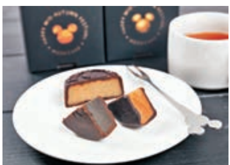
迪士尼推出的月餅。 網上圖片