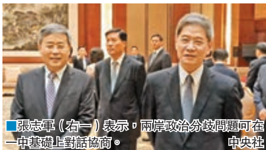
張志軍(右一)表示，兩岸政治分歧問題可在一中基礎上對話協商。

我在講到兩岸之間長期存在着一些政治分歧問題時強調，對於這些政治分歧問題，我們的態度是一貫的，那就是這些長期存在的政治分歧問題不應該一代一代傳下去，應該在一中原則基礎上，由兩岸本著相互尊重的態度，通過對話、商討來解決。如果這些政治分歧問題能解決好的話，那就可以減少對兩岸關係、兩岸各領域交流合作的衝擊。當時我講到政治分歧問題應該談，並沒有涉及所謂「各表」這個問題。