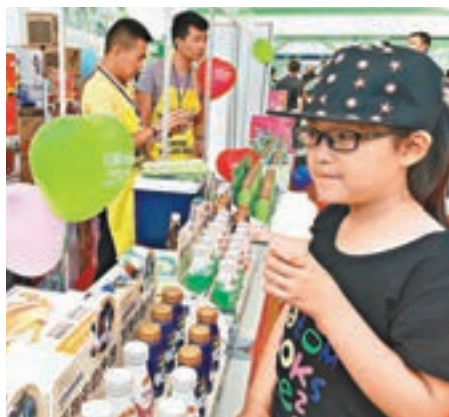
市民在「綠博會」內品嚐綠色食品。

香港文匯報訊(記者于海江齊齊哈爾報導)以「綠色、健康、合作、發展」為主題的中國(齊齊哈爾)第十六屆綠色有機食品博覽會(以下簡稱「綠博會」)日前在黑龍江省齊齊哈爾市開幕。來自國內外100餘位各界嘉賓及客商,1,200多位參展商共同見證了盛會的召開。