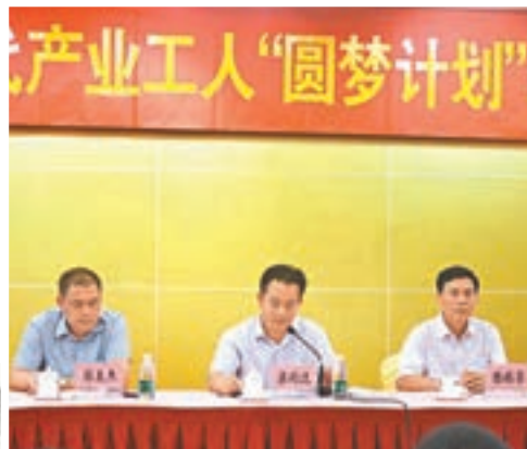
廣東啓動2016年「圓夢計劃」。

香港文匯報訊(記者敖敏輝廣州報導)為幫助新生代產業工人更好地轉型成才,廣東啓動「圓夢計劃」,幫助廣大一線務工人員入讀高校。今年,廣東財政廳將撥付2,000萬元(人民幣,下同),按每人2,000元的標準,資助1萬名「80後」、「90後」新生代產業工人報讀包括北京大學在內的37所內地知名高校。通過三年的學習,他們將獲得專科、本科學歷,成為廣東產業升級、高素質技術人才的重要力量。