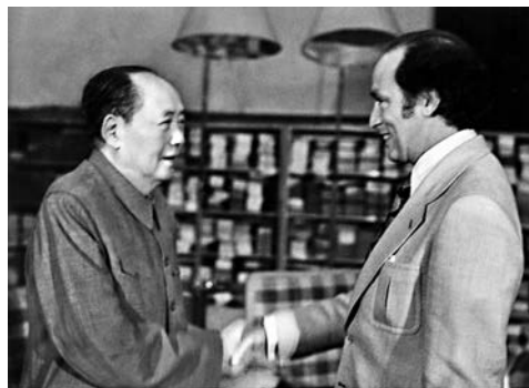
■1973年10月13日，皮埃爾·杜魯多訪華，毛澤東與他會面。

據外電報道，加拿大公民高凱文今年在中國遭到起訴，涉嫌罪名包括非法刺探、竊取國家秘密罪。