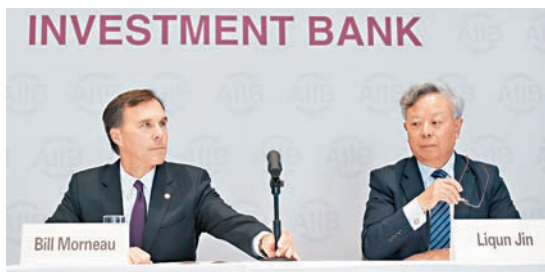
■加拿大財政部長莫諾（左）與亞投行行長金立群出席亞投行的新聞發佈會。

如今，西方七國集團（G7）中已有英國、法國、德國和意大利四國加入亞投行，加拿大正式申請後，只剩下美國和日本未明確表達加入意願。而在二十國集團（G20）中，也僅剩下日本、美國、墨西哥以及阿根廷四個國家仍在徘徊。