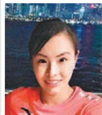
女子雙人3米跳板冠軍

不管在機場、酒店還是在跳水館，都是氣氛非常好。而且粉絲非常多，非常有禮貌，也很尊重我們運動員。從中國跳水隊來說，從起步開始，其實水準都很高。這對於我們後輩來說，其實壓力挺大的，也希望能有好的成績讓這一個優勢能夠保持下去。