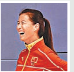
女子20公里競走冠軍

現場的觀眾都非常熱情，他們特別喜歡我們，讓我很感動，也很高興。跟他們做遊戲的時候，我發現他們非常投入，也非常喜歡參與進來。所以我覺得香港青少年對於體育的熱愛是非常高的。