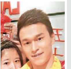
男子200米自由泳冠軍

香港發展建設有條不紊，很乾淨，市民非常熱情。對於我們來說，通過我們的一些影響力，做一些力所能及的宣傳，對香港的青少年包括香港的運動員，應該會有一些作用。也希望他們（香港運動員）在今後的大賽包括下一屆的奧運會啊、世錦賽啊，都希望他們能有好的成績。