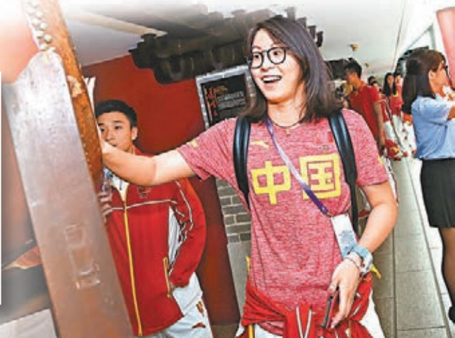
鬼馬的傅園慧稱自己最喜愛葡撻。