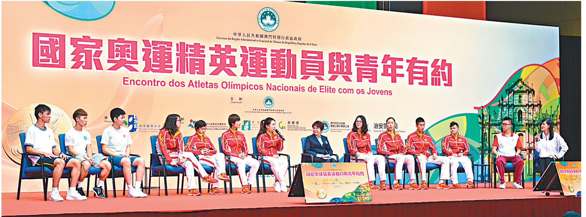
運動員們與澳門青年學生分享榮譽及背後的故事。

香港文匯報訊（記者 王海濤，實習記者 何惠玲、史家純 澳門報道）國家奧運精英運動員訪問澳門，所到之處皆受到市民及遊客的熱烈歡迎。他們與澳門青年學生分享運動員的榮譽及背後的故事；參觀澳門世遺景點大三巴牌坊、大炮台，感受澳門中西文化特色；出席澳門特區政府舉辦的「我們的驕傲——國家奧運精英運動員澳門聯歡會」，澳門小城因奧運精英的到訪而歡騰，坊間掀起熱情似火的「奧運風」。