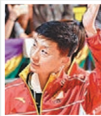
乒乓球男單、男團冠軍

這兩年香港的體育事業發展比以前進步很多了，看到他們這種進步，作為內地運動員，我覺得非常高興。這次來到香港，跟他們交流，有互動。希望香港市民對乒乓球熱愛，包括對國家體育的熱愛。特別是大家匯演我們上場的時候，市民對我們的喜愛，讓我們也感受到像內地一樣熱情。