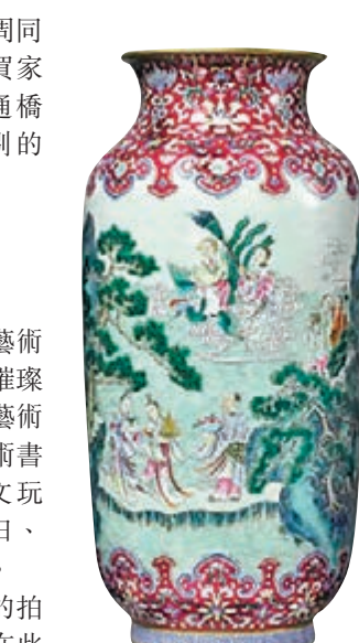
清乾隆粉彩胭脂紅地八仙慶壽圖燈籠瓶

2016年中國藝術品秋拍，由東京中央拍賣率先在日本拉開帷幕，緊接着就是9月中的紐約亞洲藝術周，蘇富比、佳士得和一般大小拍賣行都準備了琳瑯滿目的拍品，迎接全球藏家、投資者的競標。蘇富比將舉行包括坂本五郎珍藏中國高古藝術、羅伊與瑪麗蓮·派普夫婦珍藏中國繪畫、中國書畫、中國藝術珍品等有關拍賣；佳士得則將舉行大都會博物館中國瓷器、中國書畫、露芙及卡爾·巴倫珍藏中國鼻煙壺、臨宇山人珍藏、中國瓷器及工藝精品、馬克斯·弗拉克家族珍藏等多個專場。