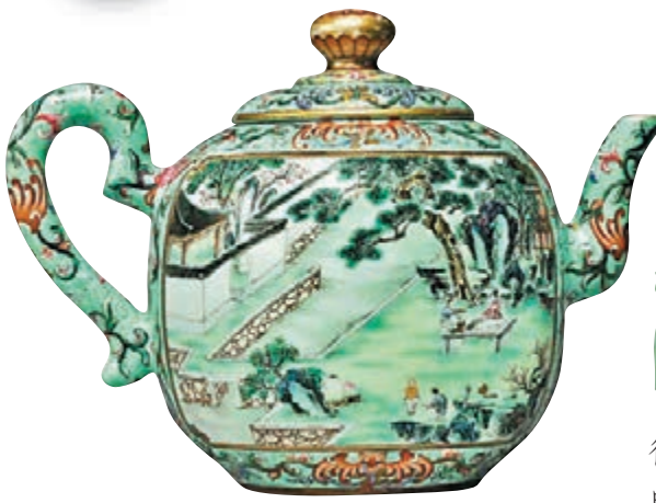
清乾隆粉彩描金松石綠地開光惠山煮泉觀卷圖御製詩茶壺

本版自創刊以來得到了廣大讀者的歡迎和支持，現特設「釋疑解難」專欄，如讀者收藏的古瓷藝術品有何疑難，可將物件拍攝成圖片電郵至：stfung@wen-weipo.com，我們將有專家作解答，敬請垂注為荷。