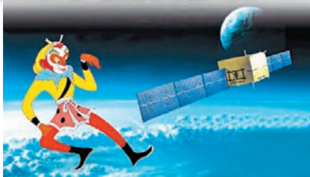
「悟空」暗物質粒子探測衛星。

航空航天技術是國之重器，如何為其成果命名，頗受民眾關注。近日，中國首個火星探測器和火星車的外觀公佈，同時向全球徵集工程名稱和圖形標識。而此前，「玉兔」月球車、「悟空」暗物質粒子探測衛星、「墨子」量子科學實驗衛星等命名，都是將現代科技與傳統中國文化結合起來，深受民眾喜愛。