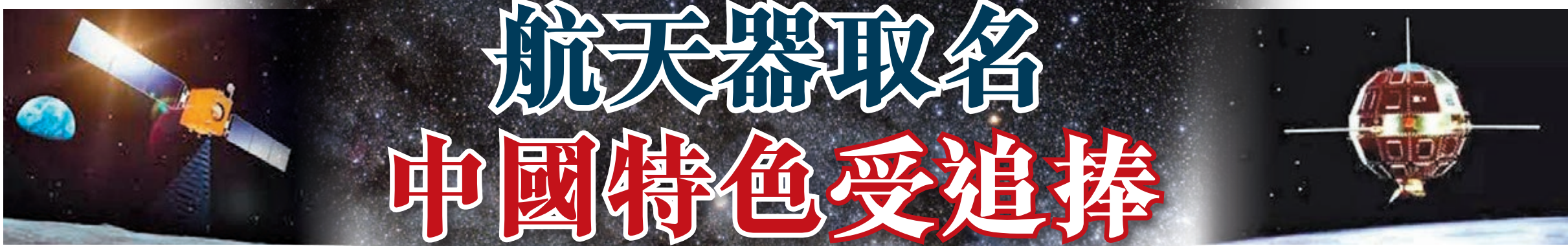
「嫦娥一號」繞月人造衛星的命名，打破了民眾對航天科技遙不可及的印象。

航空航天技術是世界高端科技之一，中國每一次航天技術成果都會受到全世界矚目。所以，給航天技術成果起一個有內涵的名字，難度不小。