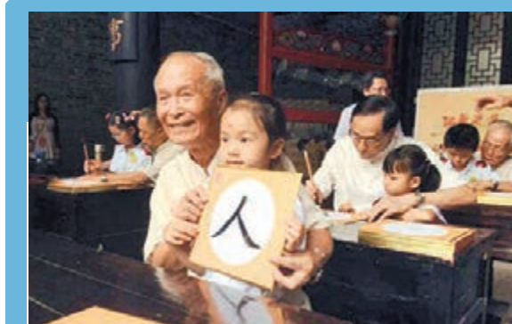
廣州小學新生施古禮入學，學寫「人」字學做人。

每次對航天科技成果的命名，實際也是對中國科技實力的一次宣介。鄧文卿表示，航天科技發展是硬實力的體現，徵名活動則是在提升文化軟實力，這種軟實力的提升又將對推廣科技實力影響產生正面作用。同時，徵名在精神層面還能夠提升國人的民族自信心與自豪感。可以說，為航天科技成果起一個好名字，不僅可以體現中國人民對航天事業的豐富情感，更可以向世界宣介中華文化的深厚內涵，展現傳統與現代相得益彰的中國形象。可見，航天成果的命名很有講究，也很有意義，其本身是文化軟實力的體現，又可以提升文化軟實力。