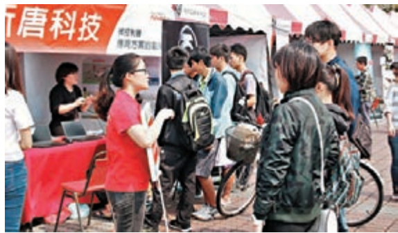
台8月消費者信心指數下降，僅「未來半年台灣就業機會」指數呈偏向樂觀。圖為學生參與台就業博覽會情景。

本次調查由「中央大學」台灣經濟發展研究中心及台灣綜合研究院主辦，台北醫學大學管理學院暨大數據研究中心調查。調查期間為8月19日至23日，以電話訪問方式進行，採電腦隨機抽樣，共訪問2,416位台灣地區20歲以上民眾，在95%的信心水準下抽樣誤差為正負2.0個百分點。