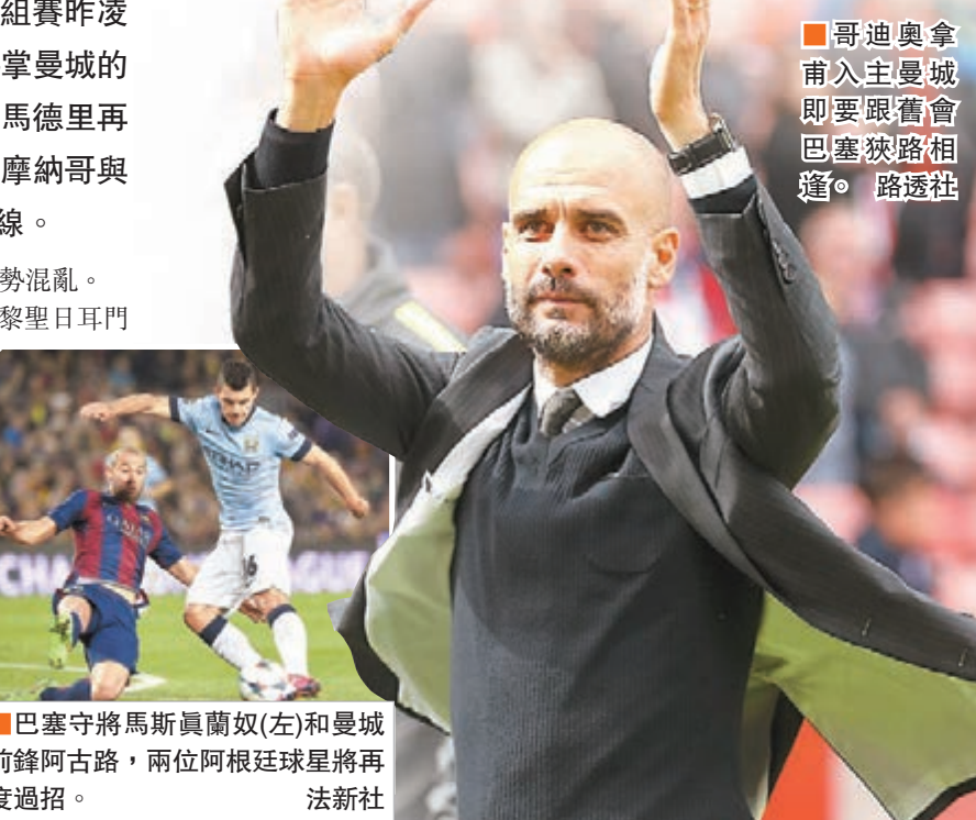
■哥迪奧拿甫入主曼城即要跟舊會巴塞狹路相逢。 路透社

另英國《太陽報》指抽籤嘉賓之一的巴西前「重炮」卡路士在抽出其中一個籤球時竟放回兜內，疑出盡感，但據悉是他當時忘了「攪勻」籤球才將球放回並補做「攪勻」的例行動作。 ■記者 梁志達