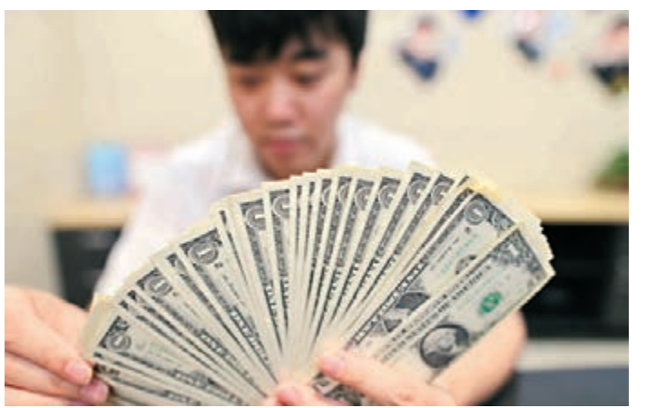
投資者對中國公司美元債券的需求飆升,大量資金的存在正在推進中企的美債債券。圖為銀行工作人員正在清點外幣貨幣。資料圖片

人民幣過去一年貶值3.53%,也將中國的資金引入了包括中國在內的亞洲美元債市場,加上全球風險偏好逐漸改善,來自歐洲日本的流動性源源不絕,且中國境內資金對外投資配置需求持續升溫,支撐了Markit中國高收益債指數