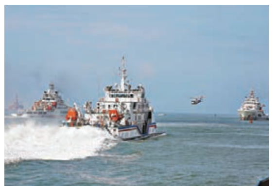
應急救援綜合演練現場。

香港文匯報訊 (記者 何玫 海南報道) 昨日上午9時許，隨着3顆紅色信號彈升空，以「高效救撈，融合發展」為主題的「2016年救撈系統南部海區應急救援綜合演練」在三亞鳳凰島附近海域正式開始。共有8艘專業救助船舶、2架救助直升機、1架無人機參與演練。