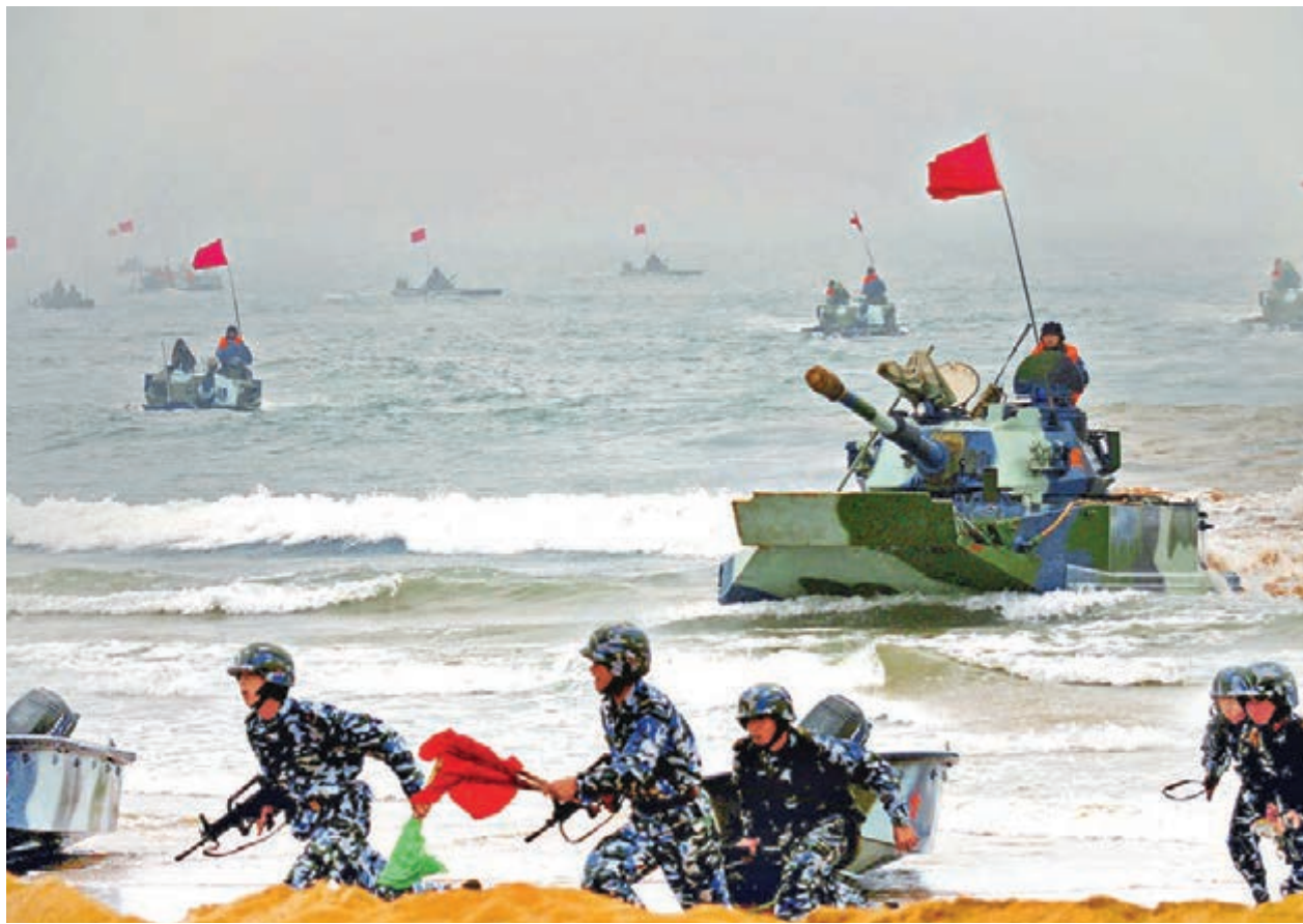
中俄下月舉行的軍演，重點演練登陸作戰。圖為海軍陸戰隊官兵演練搶灘頭陣地。

至於在南海進行登陸作戰演習會不會引起外界過度解讀，該人士表示，此次登陸作戰沒有假想敵，也不針對任何特定國家，該演習主要是演練登陸作戰的組織指揮、作戰程序和戰