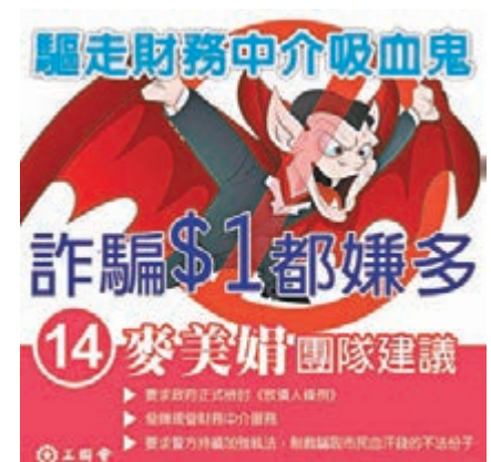
「驅走財務中介吸血鬼」為題，表明「詐騙1蚊都嫌多」，以有趣方式帶出嚴肅問題。

「驅走財務中介吸血鬼」為題，表明「詐騙1蚊都嫌多」，以有趣方式帶出嚴肅問題。她要求特區政府正式檢討