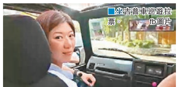
坐吉普車巡遊拉票。fb圖片

都很顛簸，在遇上不平的道路時，更有整個人被拋起的感覺，坐得她一把汗，再加上開了篷，風沿途從四面八方吹來，令她連眼睛都睜不大，幸好她頭髮短，否則將完全看不見眼前景象，而車途又長又顛簸，令她有如坐了一個下午的過山車。