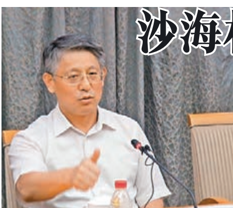
沙海林今率團前往台北，出席明日舉行的上海台北雙城論壇。

香港文匯報訊 據中央社報道，將率團出席上海雙城論壇的上海市委常委沙海林昨天表示，上海很早就以實質行動支持台北辦世界大學運動會，也很希望台北辦好世大運。