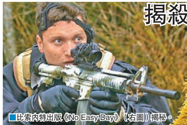
比索內特出版《No Easy Day》(右圖)揭秘。