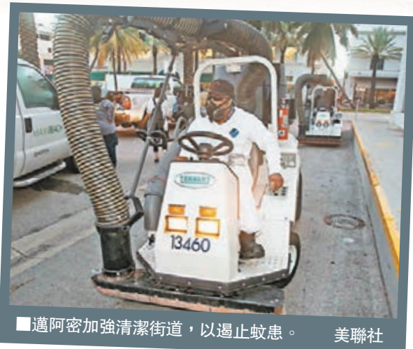
邁阿密加強清潔街道，以遏止蚊患。