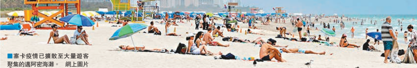
寨卡疫情已擴散至大量遊客聚集的邁阿密海灘。網上圖片

美國疾病控制及預防中心(CDC)官員前日表示，在佛羅里達州邁阿密的寨卡疫情已擴散至大量遊客聚集的邁阿密海灘，已知至少5人受到感染，包括一名台灣遊客，令佛州本土感染個案增至36宗。因寨卡病毒可引致嬰兒小頭症等疾病，CDC已把邁阿密海灘納入孕婦旅遊警區。