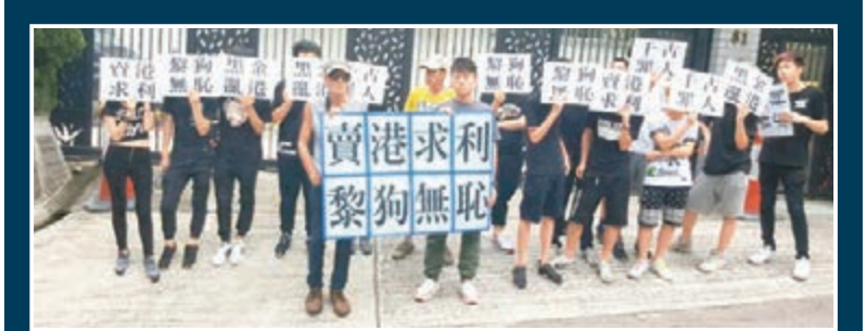
「黎」庭掃奸 愛港促進會及香港發展關注組昨日先後前往壹傳媒集團創辦人黎智英位於九龍何文田的住處,對於黎智英收受黑金及壹傳媒亂港禍中的行徑予以強烈譴責。兩個團體各有20多名成員,分別在召集人蘇先生及張先生帶領下,高舉「賣港求利 黎狗無恥」、「黑金亂港 千古罪人」、「天譴漢奸黎」、「黎智英大頭頭」等紙牌,抗議黎智英禍殃民,活動持續3個小時。記者 文森