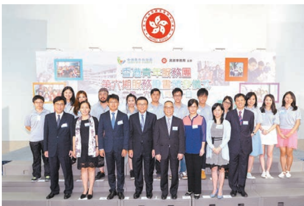
陳家強頒發服務證書予香港青年服務團計劃十三名團員。

香港文匯報訊(記者 文森)署理財政司司長陳家強昨日向香港青年服務團計劃(第六期)的十三名團員頒發服務證書,表彰他們在廣東省韶關市和梅州市義務工作的優秀表現和服務他人的精神。