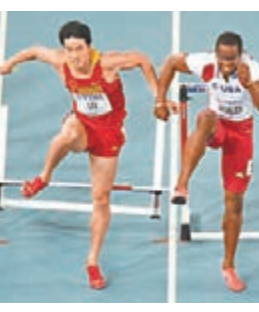
5年前世錦賽劉翔(左)受羅伯斯影響，無緣金牌。

田徑比賽意外常見，不少優秀選手都曾因對手干擾而與金牌失之交臂。譬如已退役的前世界欄王劉翔，他在2011年參加大邱世錦賽時也吃過苦頭，當時在110米欄決賽劉翔眼見衝線在即之際，隔鄰線的古巴好手羅伯斯意外地碰到自己，導致失原本應可到手的金牌。縱使賽後中國隊提出抗議，但賽會只是取消了羅伯斯的成績，冠軍依然是美國代表，劉翔未能享受到重賽的美果，只得一面銀牌。