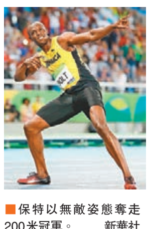
保特以無敵姿奪走200米冠軍。