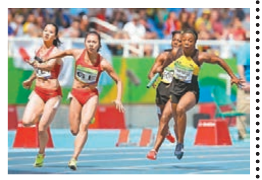
中國姑娘(紅衫)拚盡全力，但與決賽大門緣慳一面。

對於中國女子接力隊受到不公平對待，國際排聯終身名譽主席魏紀中昨日在里約接受傳媒訪問時直指是與國際體育界沒有中國人任要職有關。就賽事談判，魏紀中指往往是來自裁判水準和裁判對某選手或隊伍有偏心、偏見所致，而避免遭受不公判罰，他表示關鍵是要掌握話語權。 魏紀中提到中國曾有兩名國際體壇要員，分別是排球界的馬奇偉和田徑界的樓大鵬。由於現時在國際體育組織任職的中國人，多為由政府委派或推薦的體制內人員，一旦他們在體制內的身份有所變化，就要讓出其國際組織的職位，這很難保證跟國際體育組織關係的穩定性。