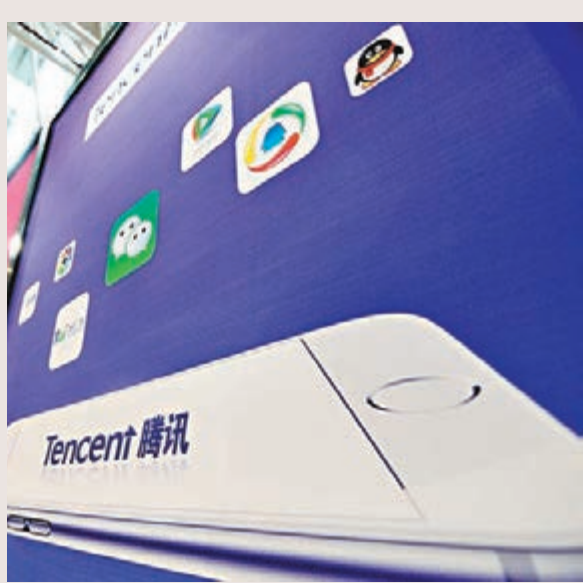
「股王」騰訊昨升穿200元大關,即拆細股份前的逾1,000元,總市值增至逾1.9萬億元。

國指跑輸大市,全日只升12點,報9,654點。獨立股評人陳永陸表示,現時市場流動性遠高於「滬港通」宣佈開通時水平,而加息速度緩慢也是市場共識,所以全球流動性必會持續增加。此外,互聯互通的總額限制的取消,會有利更多內地資金來港,故認為港股後市可看高一線。