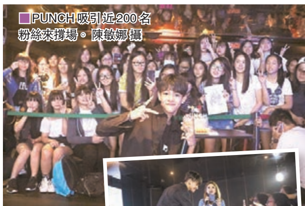
粉絲表現瘋狂爭握手。陳敏娜攝