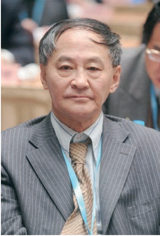
全國政協委員黃方毅 本報北京傳真