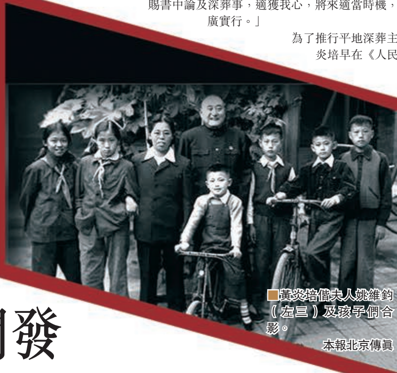
黃炎培偕夫人姚維鈞(左三)及孩子們合影。