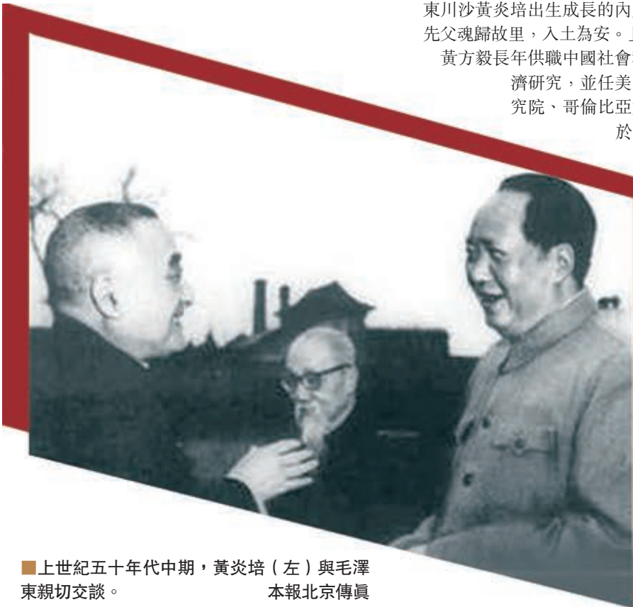
上世紀五十年代中期，黃炎培(左)與毛澤東親切交談。

近期內地熱播的電視劇《海棠依舊》第19集中，在黃炎培與毛澤東關於平地深葬一事互動不久，時任國務院副總理兼秘書長的習仲勳，獲悉毛澤東贊同黃炎培提出的平地深葬意見之後，隨即向周恩來報告此事。於是同年6月，周恩來與鄧穎超致信淮安縣委：「我家的一點墳地，落在何方，我已記不得了。如淮安提倡平墳，有人認出，請即採用深葬法之，不必再徵求我的意見，我先此函告為證。」1965年，根據周恩來指示，將他的祖父母、生母等7座土墳全部挖開深埋，平掉土包，去塚還耕於民。