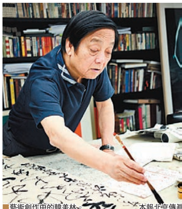
■ 藝術創作中的韓美林。