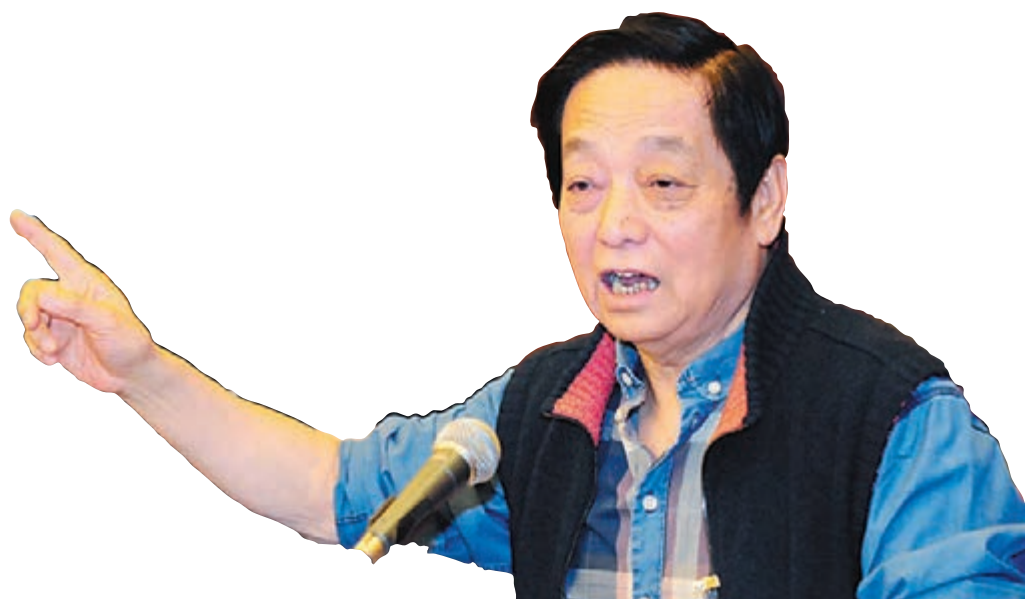
■ 全國政協常委、著名藝術家韓美林。

中央要求，北京城市副中心建設要「着力打造國際一流和諧宜居之都示範區、新型城鎮化示範區、京津冀區域協同發展示範區」，要「精心推進，不留歷史遺憾」。