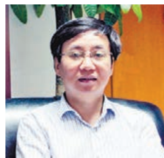
■ 中國城市規劃設計研究院副院長李迅。

作為資深城市規劃設計專家，中國城市規劃設計研究院李迅副院長，從1982年參加工作至今，始終服務於中國城市規劃設計研究工作，並親歷了中國改革開放30多年來中國城市發展變化的所有進程。